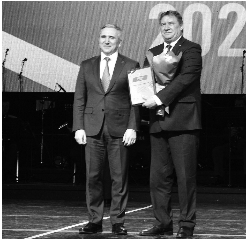
На снимках: фрагменты торжества