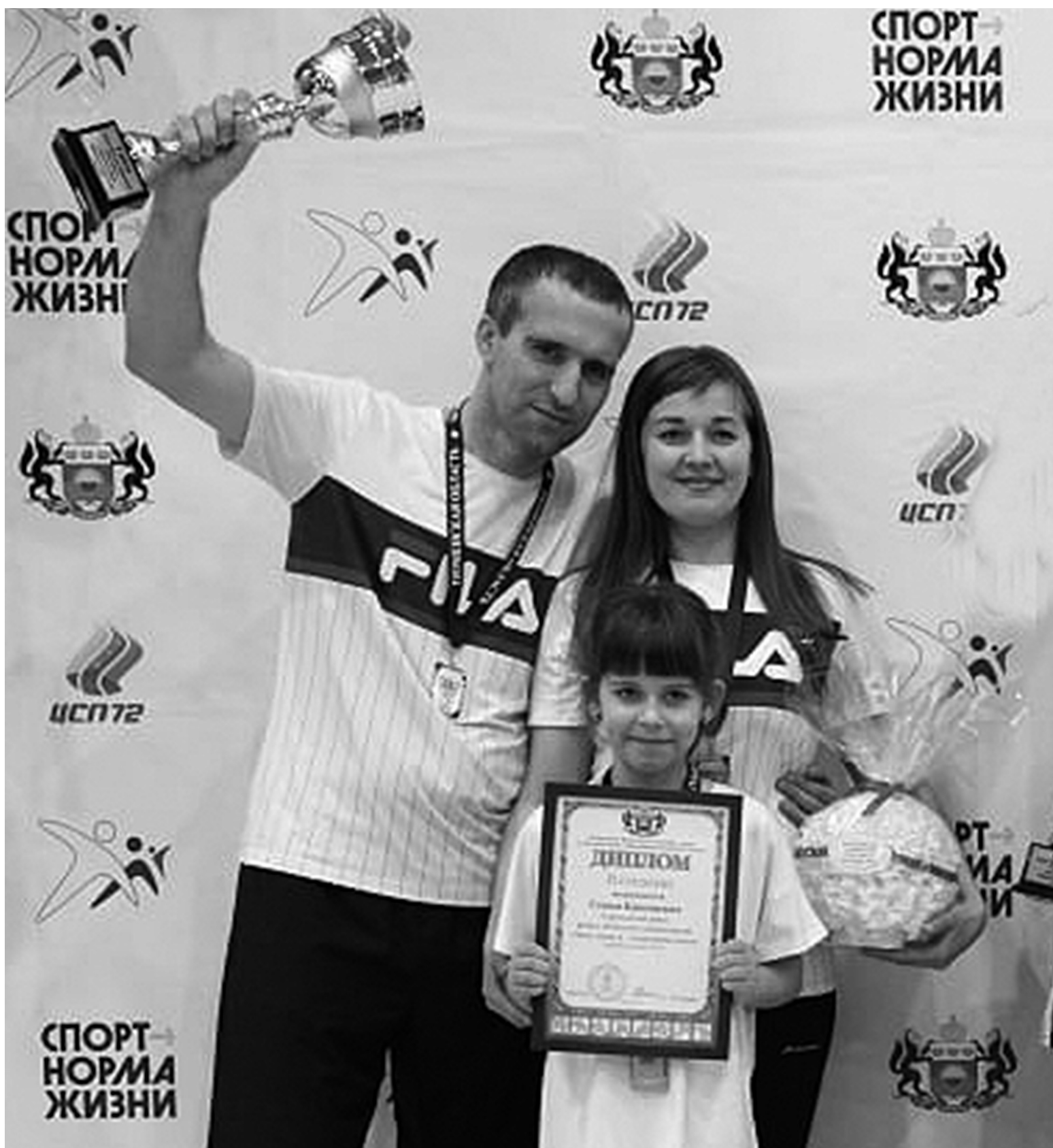
Вторая ступень на пьедестале почёта – у сорокинской семьи

интересно, уходили мы после них на эмоциональном подъёме.