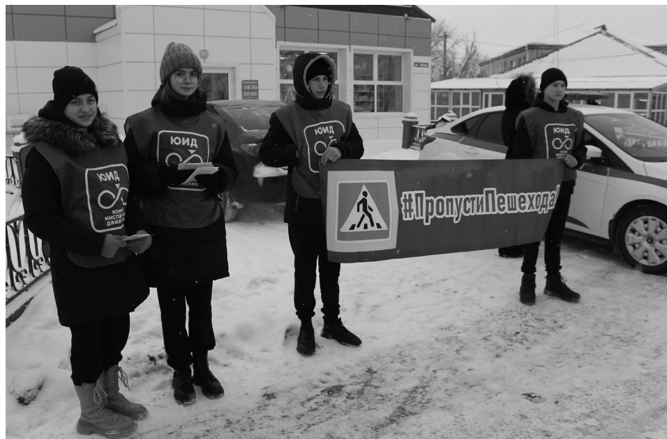
Юные инспектора движения вышли на акцию в центр села

– В текущем году произошли два дорожно-транспортных происшествия с участием несовершеннолетних, они произошли по вине самих несовершеннолетних граждан. Поэтому проводим подобные меропри-