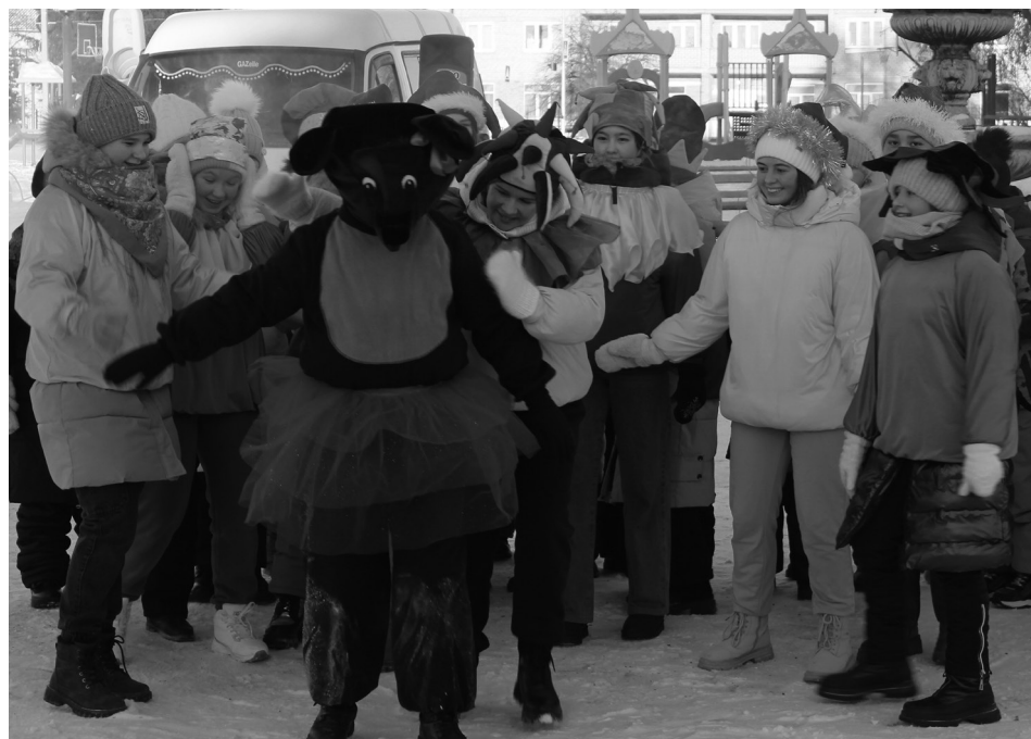
Ярмарка удалась на славу!