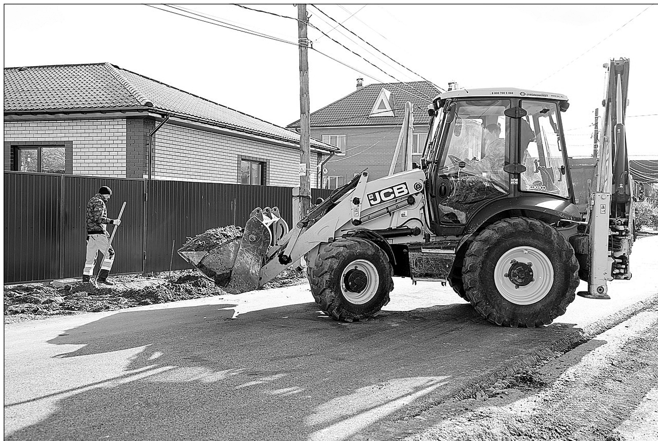
В Тюменском районе строятся дороги.