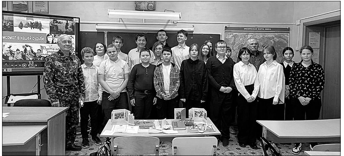
Юнармейцы 86 класса и их почетные гости.