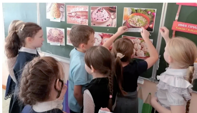
На станции «Национальное блюдо».

ставлены традиции разных народов. Ребята узнали больше о культуре русских, татар, башкир, бурят, якутов, хантов и других народов.