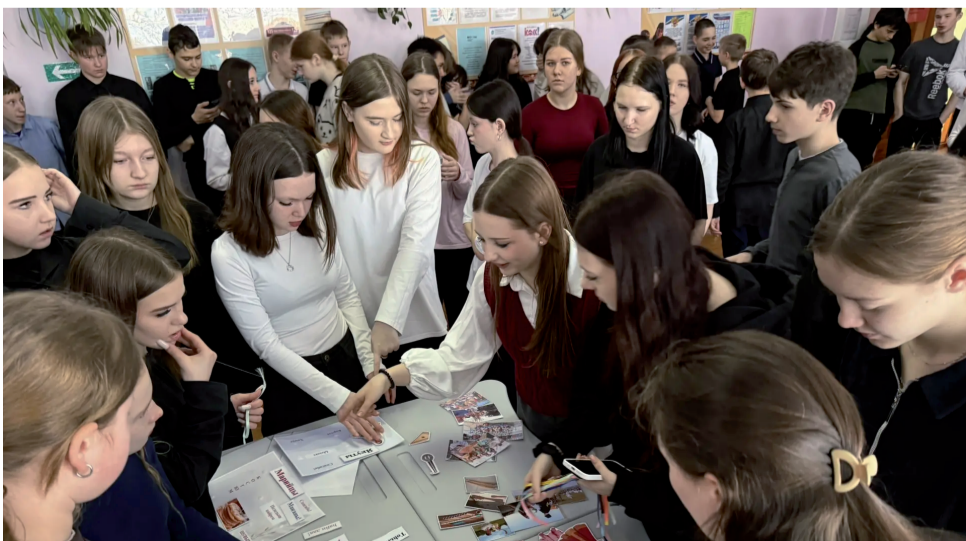
Команды знакомятся с национальными костюмами.

Ю.А. ЗАХАРЧЕНКО, МАОУ «Демьянская СОШ им. Гвардии матроса А. Коптилова» Фото автора