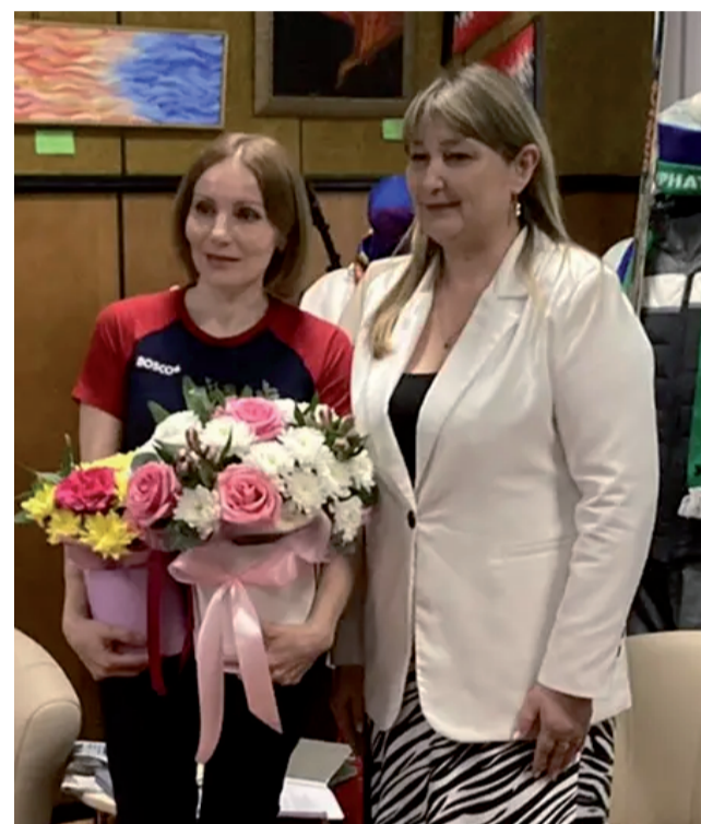
Букет цветов для олимпийской чемпионки.

Самая памятная, самая ценная - безусловно, третья, где я завоевала золотую олимпийскую награду, к ней я шла очень долго. У меня еще в шесть лет зародилась мечта стать олимпийской чемпионкой. На первой Олимпиаде не