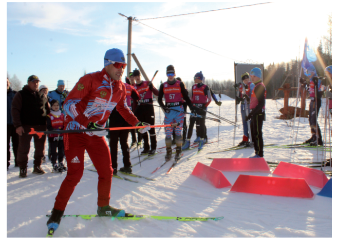
Технический элемент в исполнении заслуженного мастера спорта.