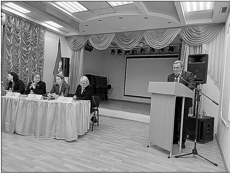
В президиуме собрания.