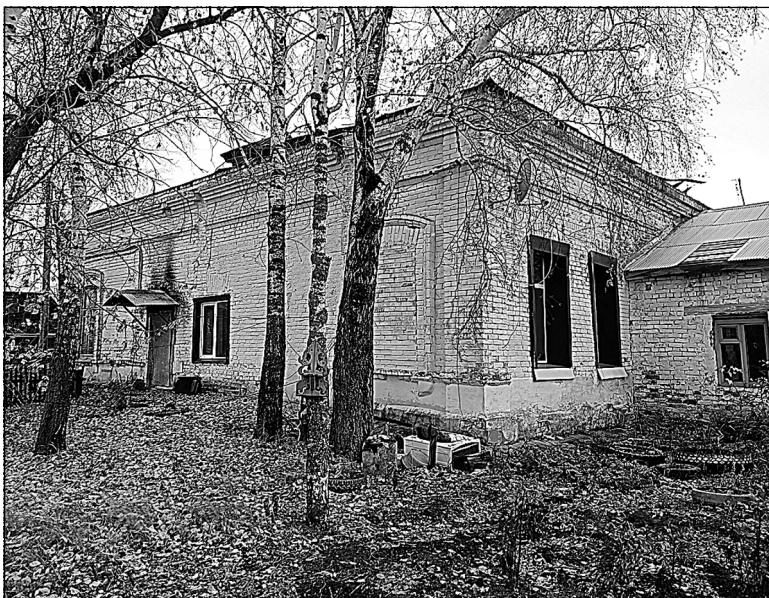
Здание учительской школы в Зырянке.