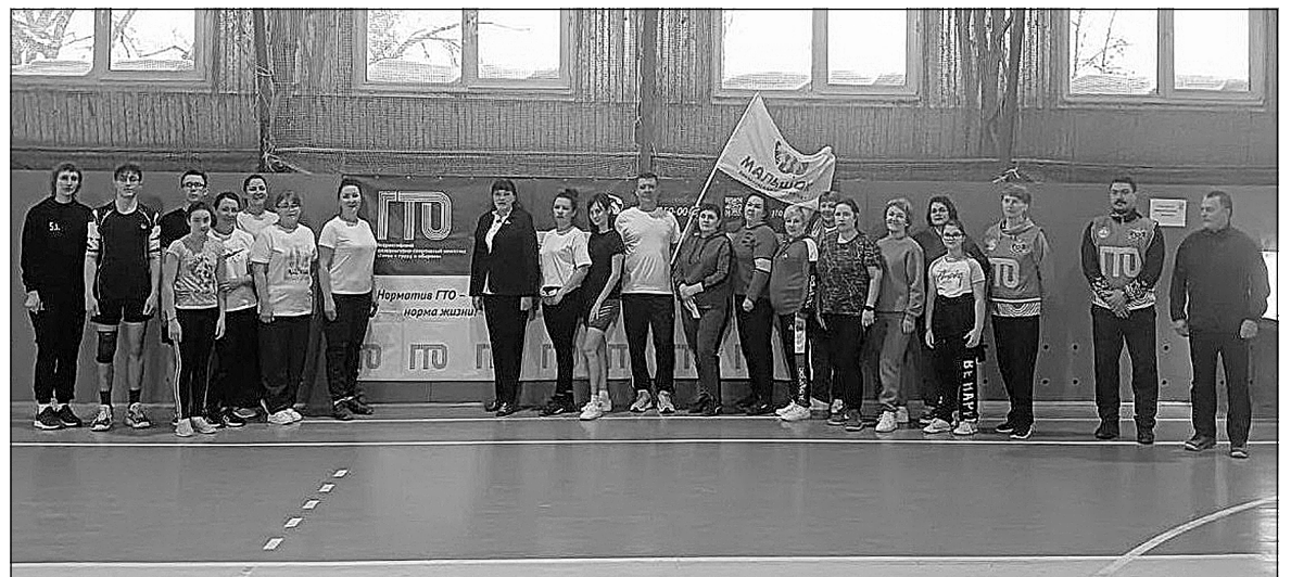
Дружная команда «Малышка» успешно сдала нормативы комплекса ГТО.