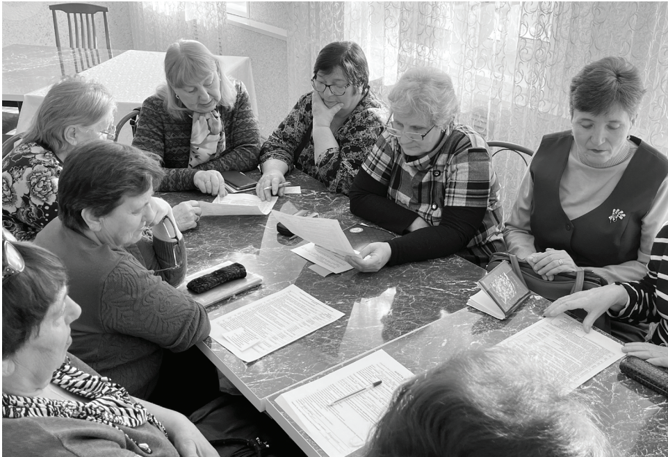
Добровольцы обсудили планы на текущий год и получили заслуженные награды.

Обсуждался план работы штаб-квартиры добровольчества на 2024 год. События расписаны на весь период текущего года, в каждом месяце по несколько мероприятий. Так, например, январь и февраль был посвящён акции «Мы вместе», волонтеры собирали посылки военнослужащим СВО. Весной «серебряные» добровольцы будут принимать участие в других, не менее важных акциях: «Красная гвоздика», «Чистота вокруг нас», «Победа»,