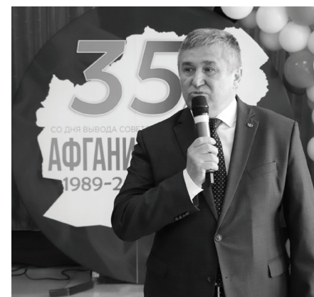
Сладковские ветераны почтили память боевых товарищей.

Мероприятие прошло в преддверии Дня защитника Отечества и было посвящено 35-ей годовщине вывода советских войск из Афганистана.