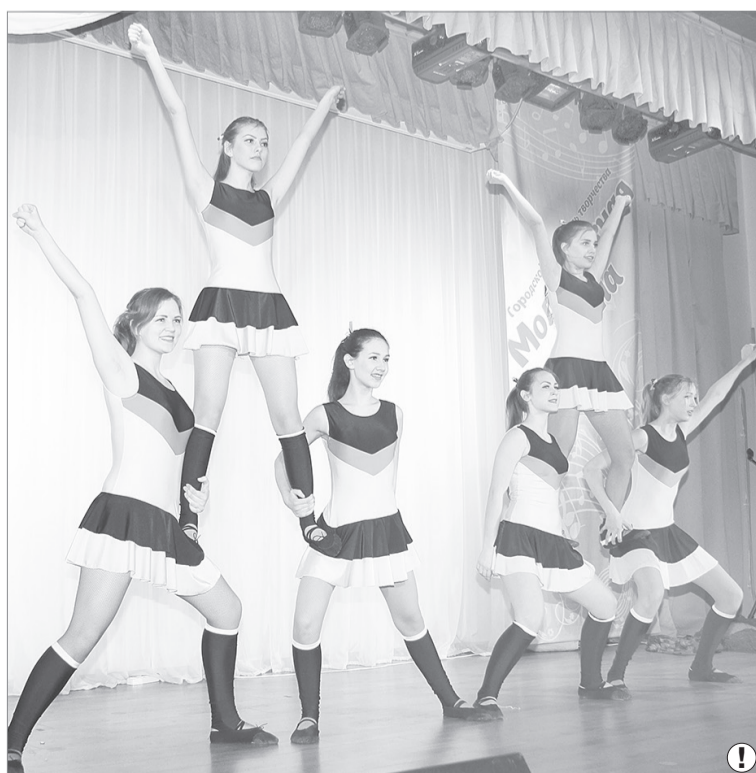
Пирамиды от «Mango»