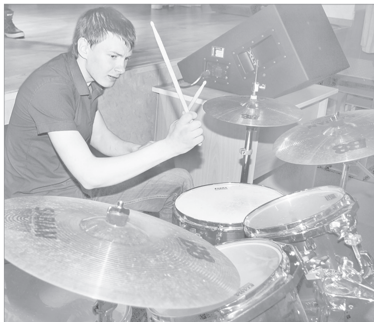
Соло от ударника