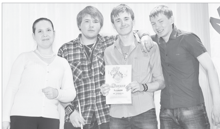
«Трамвай № 13»

Жюри, работавшему в течение недели, предстояло выбрать самых лучших исполнителей во всех номинациях. Они-то и со-