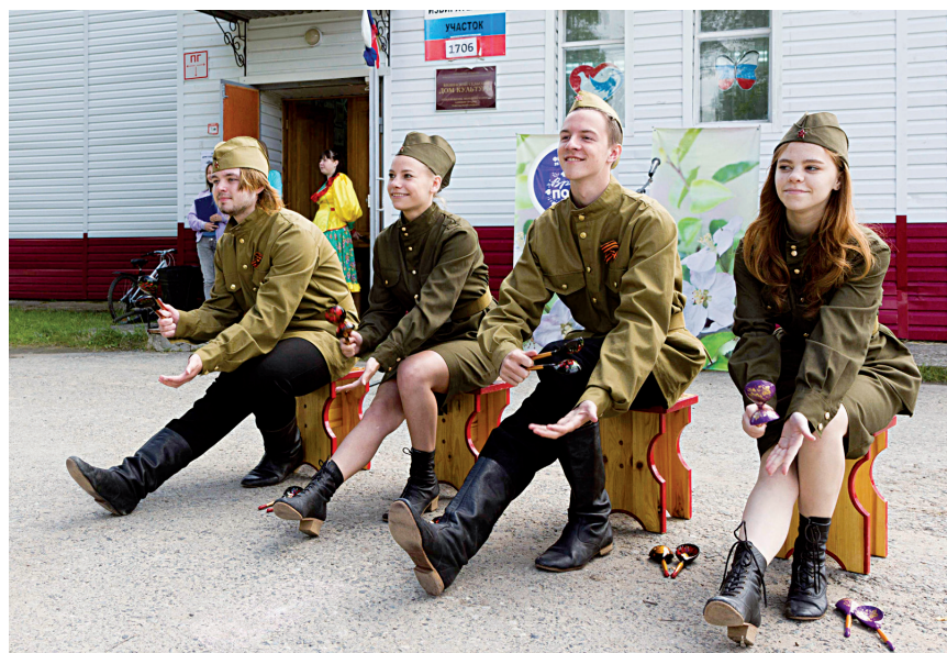
Ансамбль «Весёлые ложки»

И вот недавно бизинцы вновь засветились. В центр культуры Тобольского района пришло известие о том, что коллектив стал обладателем Гран-при международного многожанрового конкурса-фестиваля «MUZSTART FEST», проходившего летом в режиме онлайн и завершившегося в Москве. Так высоко оценила конкурсная комиссия фестиваля мастерство, самобытность и вдохновение самодеятельных артистов из сельской глубинки. Коллекция дипломов