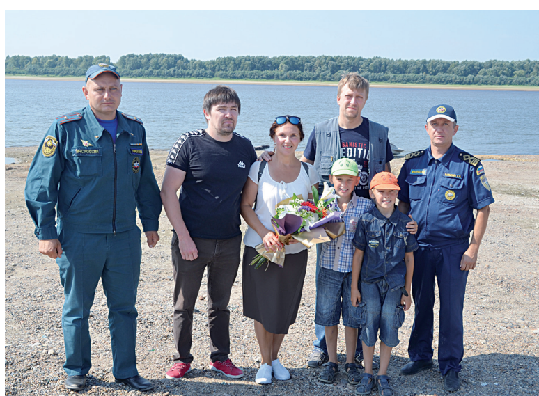
Цветы и подарки для спасателей

На Тоболе в районе Хмельовой утонул мужчина 1980 года рождения. Тело пока не нашли – спасатели-водолазы продолжают поиски. Утонувший был не из местных, возможно, в гости к родственникам приехал. Плавать не умел. Решил помыться. Намылит голову, торс и окунулся, чтобы смыть пену, да больше на поверхности воды не показался. Говорят, катер к этому берегу причаливал, днищем яму вырыл. Так что мужчина, видимо, прямо в неё и угодил, нахлебался воды, а там течением подхватило.