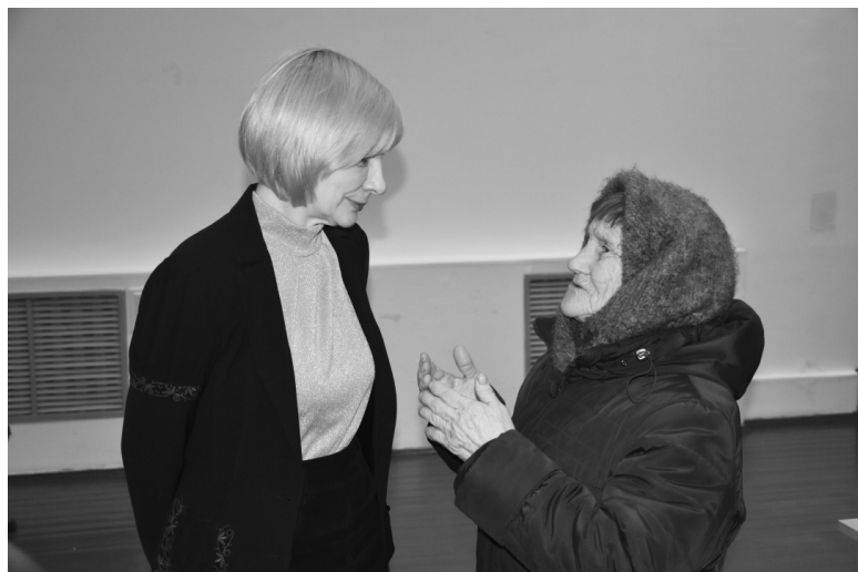
Жители поселения активно участвовали в собрании, интересовались вопросами дорожного строительства, благоустройства и качества сотовой связи

Вниманию избирателей! 16.03.2023 состоится прием граждан по вопросам к Депутату Тюменской областной думы Владимиру Ульянову. Личный прием состоится в здании районной администрации с 11.00. до 13.00. Возможна дистанционная форма приема в указанное время по телефону 8-912-397-49-05. Прием ведет помощник депутата Тюменской областной Думы А. А. Горбунов.