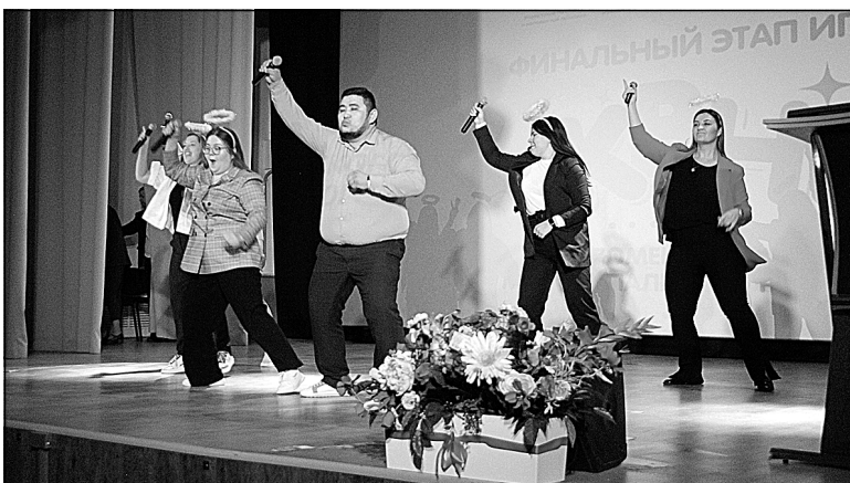
Боровские педагоги — с юмором о своей профессии.

Клубу Веселых и Находчивых в 2023-м исполнилось 62 года. В день рождения КВН в Тюменском районе состоялся финальный этап игр среди учащейся, студенческой и работающей молодежи.