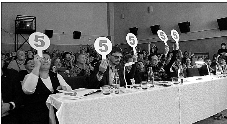
Оценка — круглая пятерка!

Девять команд — призеров отборочных туров сошлись на сцене центра досуга и культуры «Родник» в селе Успенка. Это школьные команды из Московского, Новотарманского и Успенки, студенческие из Ембаево, Каскары, Новотарманского и команды работающей молодежи из Боровского, Богандинского, Винзилий.