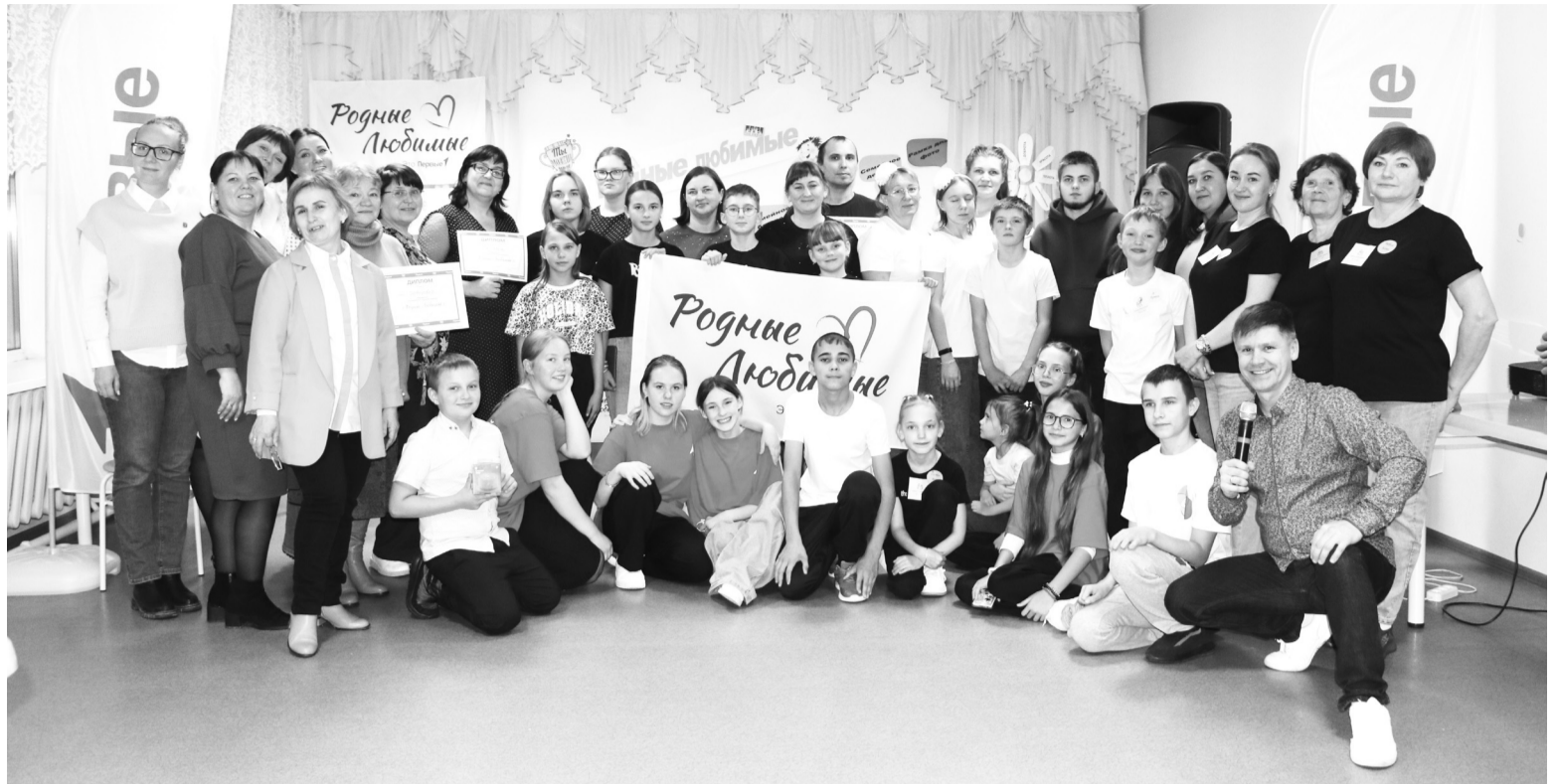
|| Участники форума "Родные-Любимые" в селе Слобода-Бешкиль.

Во многих семьях есть вещи, которые передаются из поколения в поколение, к ним относятся с почтением. У моей