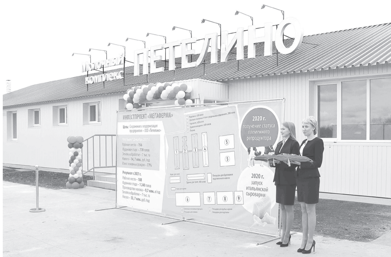
Открытие мегафермы в Петелино в прошлом году стало одним из значимых событий в агропромышленном комплексе района

■ СПРАВКА «ЯЖ». Республика вошла в число российских регионов после проведенного в марте 2014 года референдума, на котором 96,77% избирателей Крыма и 95,6% жителей Севастополя высказались за вхождение в состав России. Крымские власти провели референдум после госпереворота на Украине в феврале 2014 года.