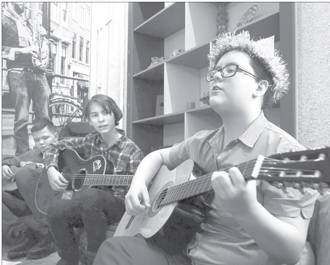
На квартирнике в городской библиотеке юные гитаристы исполнили любимые композиции

В конце февраля в детском саду № 10 проходила тематическая неделя. Ребята узнали историю праздника и о том, кого называют защитниками Отечества. Посмотрев презентацию о службе в Вооружённых силах, увидели, чем занимаются солдаты в мирное время. Познакомились с разными родами войск, военными профессиями, обсудили, какими качествами должен обладать