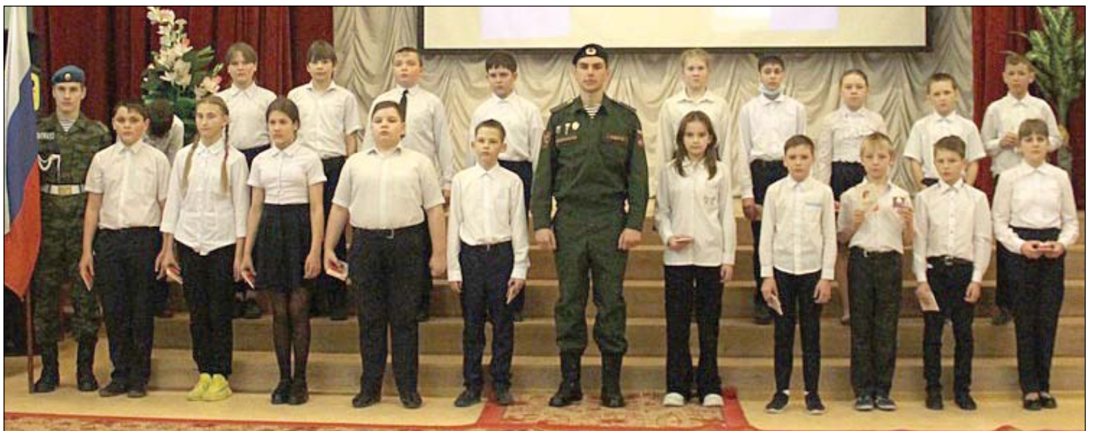
• Вступление в ряды юнармейцев – запоминающееся событие для юных аромашевцев.