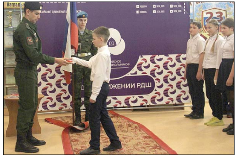
• Ребятам вручили нагрудные значки и свидетельства юнармейцев.