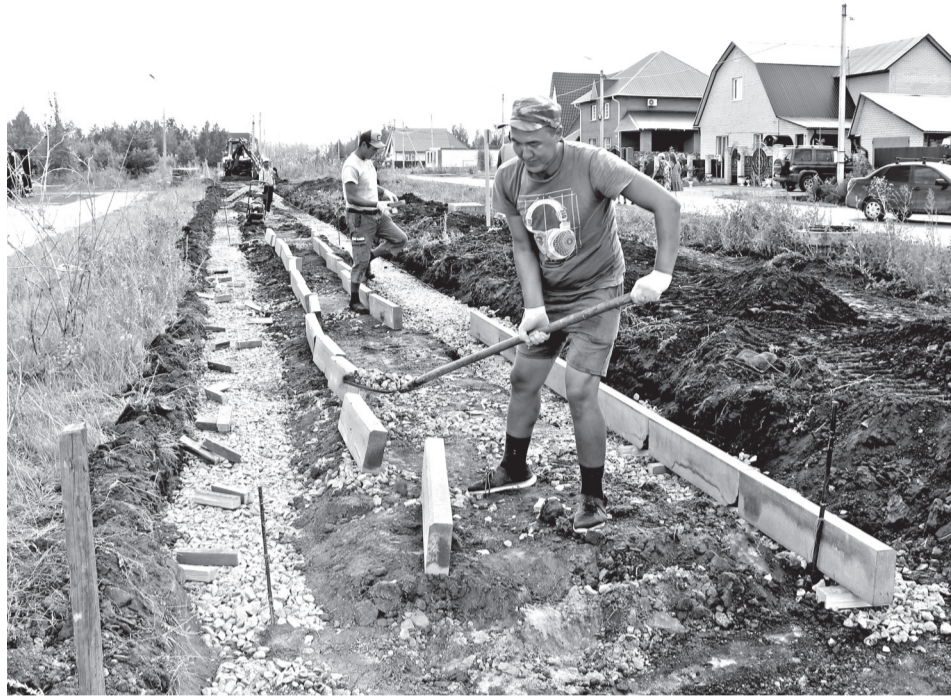
• Скоро на улице Каретной в городском микрорайоне Новом будет добротный тротуар.