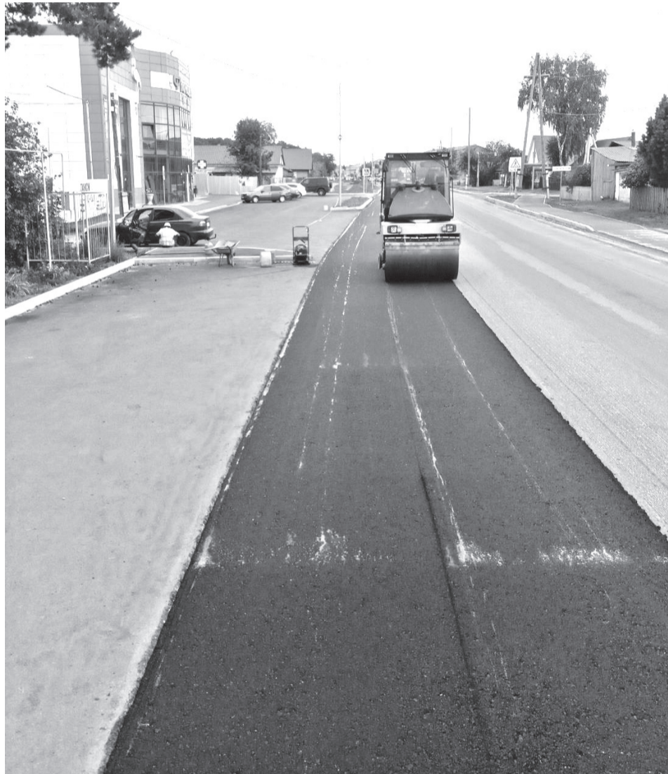
• Участок городской улицы Шоссейной от Пушкина до Советской в ходе ремонта заметно преобразился.