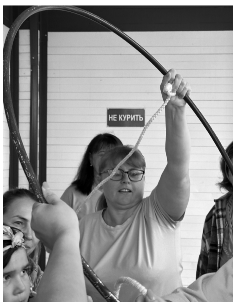
Многочисленные испытания позволили погрузиться участникам в легендарную телевизионную игру «Форт Боярд»