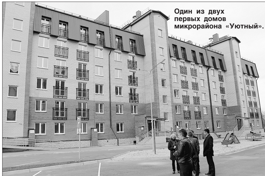
Один из двух первых домов микрорайона «Уютный».