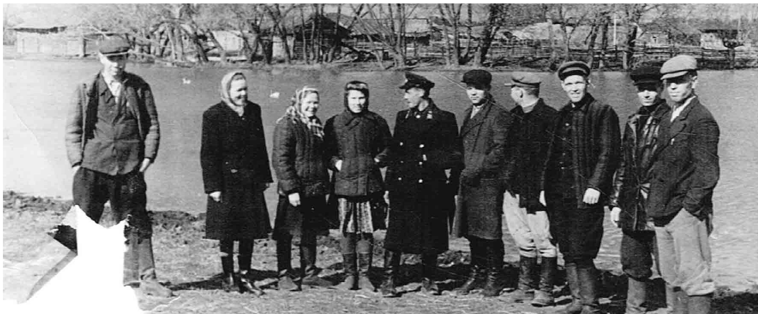
Работники колхоза имени Свердлова в минуты отдыха, село Большой Краснояр, 1952 год