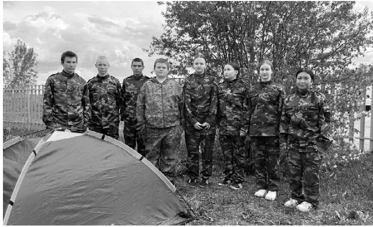
Сосредоточенные лица и готовность к действию. Отряд Шабановской школы на старте военно-спортивной эстафеты

В программу соревнований был включен смотр строя и песни. Участники продемонстрировали строевую выучку, слаженность действий и дисциплину, пройдя торжественным маршем и исполнив строевые песни.