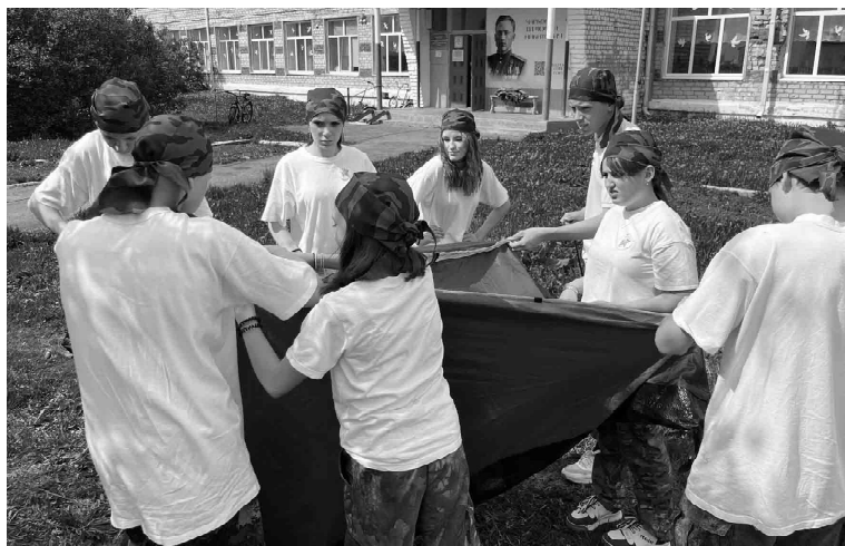
Слаженная работа - залог успеха в любом деле. Отряд Журавлевской школы учится устанавливать палатку

Последующие этапы включали проверку знаний по истории Отечества и основам начальной военной подготовки. Одним из наиболее динамичных испытаний стала военизированная эстафета. В ней участники проявили скорость, ловкость и навыки командного взаимодействия. На площадке «Выживание в экстремальных условиях» школьники показали умение в ориентировании на местности и оказании первой доврачебной помощи.