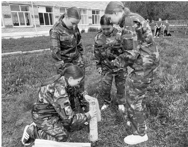
От теории к практике. На площадке «Выживание в экстремальных условиях» юные бойцы продемонстрировали умение быстро разводить костер - ключевой навык для любого туриста и будущего защитника