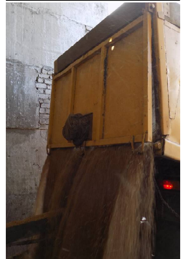
➤ Разгрузка зерна