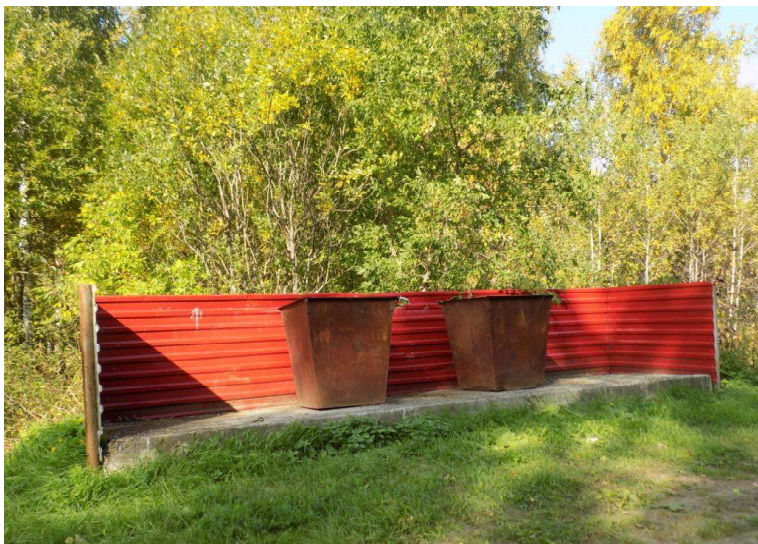
➤ Утром 9 сентября контейнеры на Викуловском кладбище были пустыми.