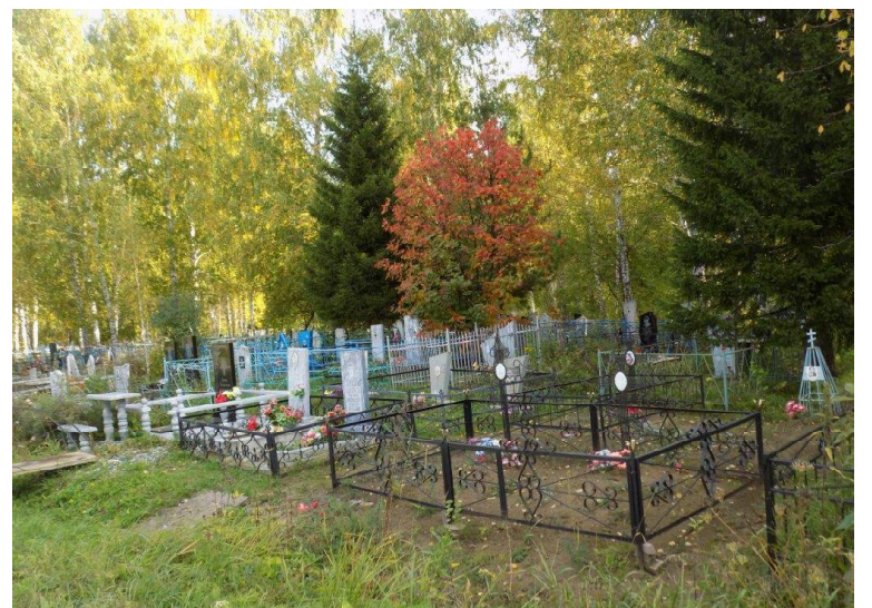
➤ Викуловчане следят за могилами родственников...