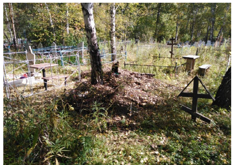
➤ ...однако можно встретить и вот такие кучи мусора