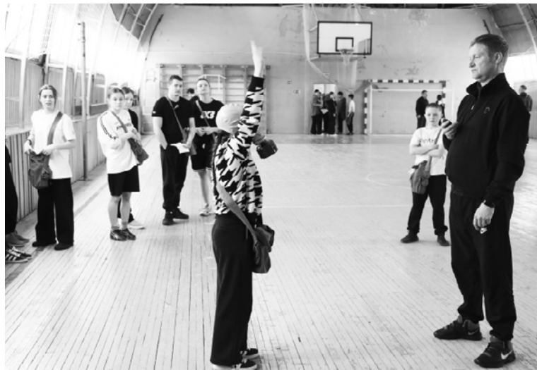
|| Одно из заданий – правильно надеть противогаз