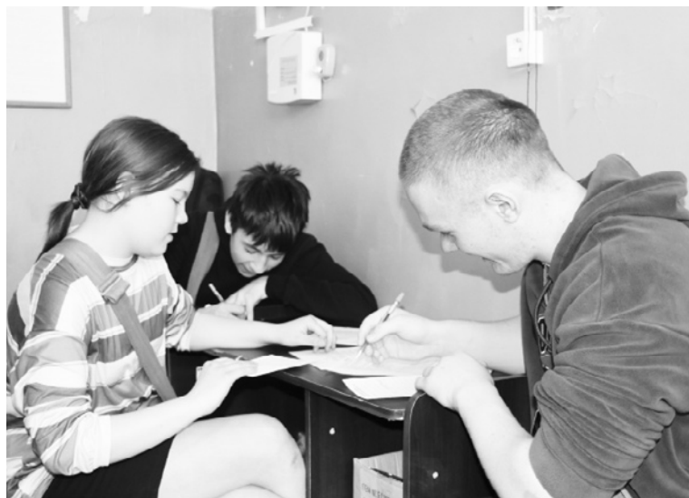
|| Тестирование по ОБЖ