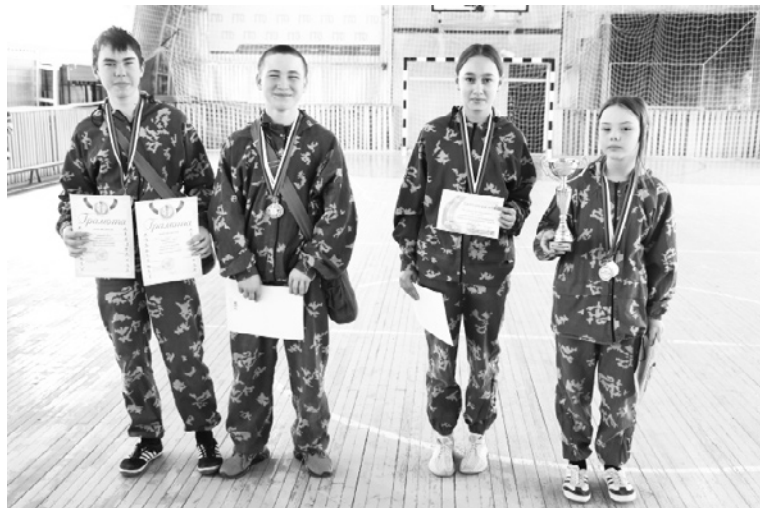
|| Команда верхнебешкильской школы.

товцев, бархатовцев и слободабешкильцев. По тестированию ОБЖ блеснули знаниями коммунаровцы, рассветовцы и шороховцы. В челночном беге хорошо себя показали коммунаровская, вторая райцентровская и слободабешкильская школы. По силовой гимнастике в командном зачете победили коммунаровцы, слобо-