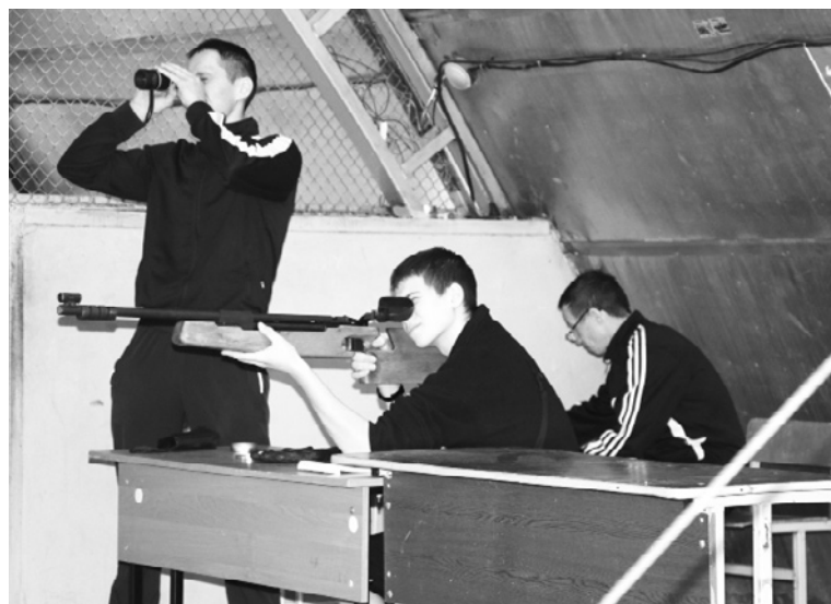
|| Стрельба из пневматической винтовки

В командном зачёте по стрельбе наградили рассве-