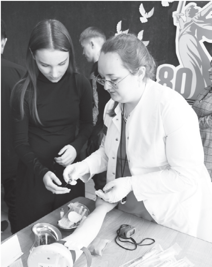
На площадке медицинского колледжа школьники могли попробовать сделать внутривенную инъекцию.

– Я сегодня, как и дети, под большим впечатлением от проведённой ярмарки. Рада, что такое количество детей приехало в Молодёжный центр для участия в этом важном для их будущего мероприятии. Эмоции от увиденного мастер-класса Тюменского медицинского колледжа переполняли, понравился очень подробный рассказ о Тюменском индустриальном университете. Здорово, что дети интересуются определёнными специальностями. Кто-то не мог определиться, что хочет, поэтому подходил к каждому представителю учебных заведений. На сегодняшний день, Ярмарки учебных мест являются актуальными и нужными, так как не каждый школьник имеет представление о вузах и колледжах, о том, сколько их сегодня, – де-