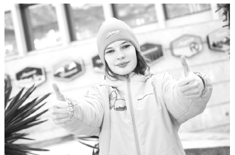
|| Фото из личного архива Елизаветы Прокопьевой

– Мы проходили различные игры, ставили мероприятия и танцы. И практически каждый день были концерты, настолько трогательные и красивые, что плакали даже мальчики. А вечером, под конец дня, собирались массовки. Каждый вставал в свой отрядный круг и повторял движения за тем, кто