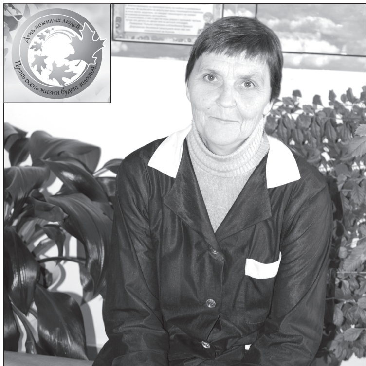
Фото из семейного альбома