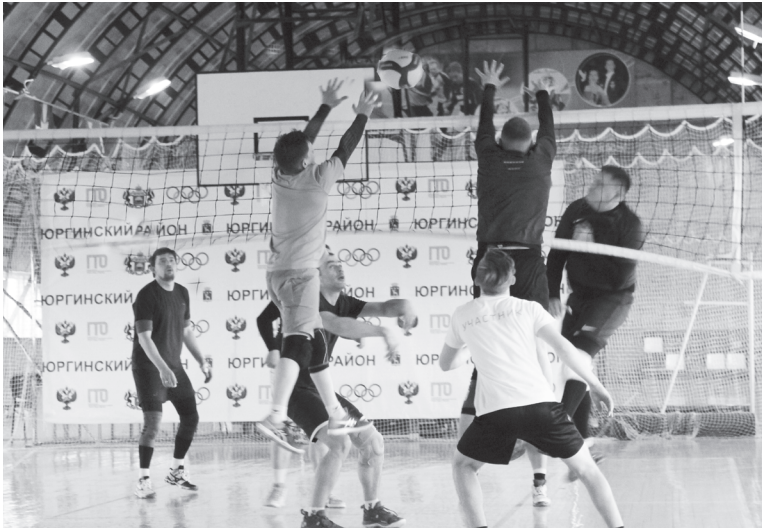
На волейбольной площадке упорная борьба за каждый мяч

Только две команды – лабинцы и «Студенты» – отыграли в подгруппах без поражений. У володинцев, агаракцев, Юргинского отделения Голышмановского агропедколледжа и второго корпуса ЮСОШ – одна победа и одно поражение. В финал вышли «Студенты», команды Лабинского и второго корпуса ЮСОШ.