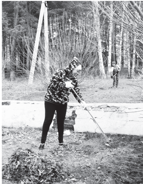
Редакция районной газеты «Призыв» приехала в Шипаково в самый разгар субботника