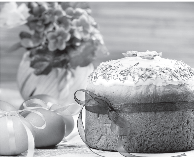
Крашеные яйца и кулич – традиционные блюда пасхального стола

Тесто: 500 г муки, 1,5 стакана молока, 6 яиц, 150 г сливочного масла, 150 г маргарина, 1,5-2 стакана сахара, 50 г дрожжей, 0,5 чайной ложки соли, по 50 г изюма и ванильного сахара.