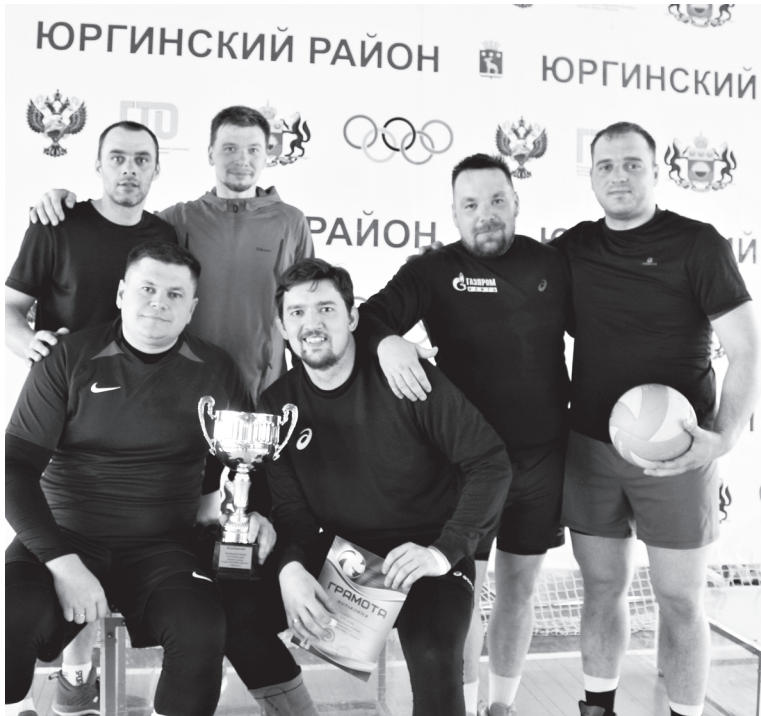
Команда «Студенты» – победитель юбилейного турнира на приз районной газеты «Призыв»