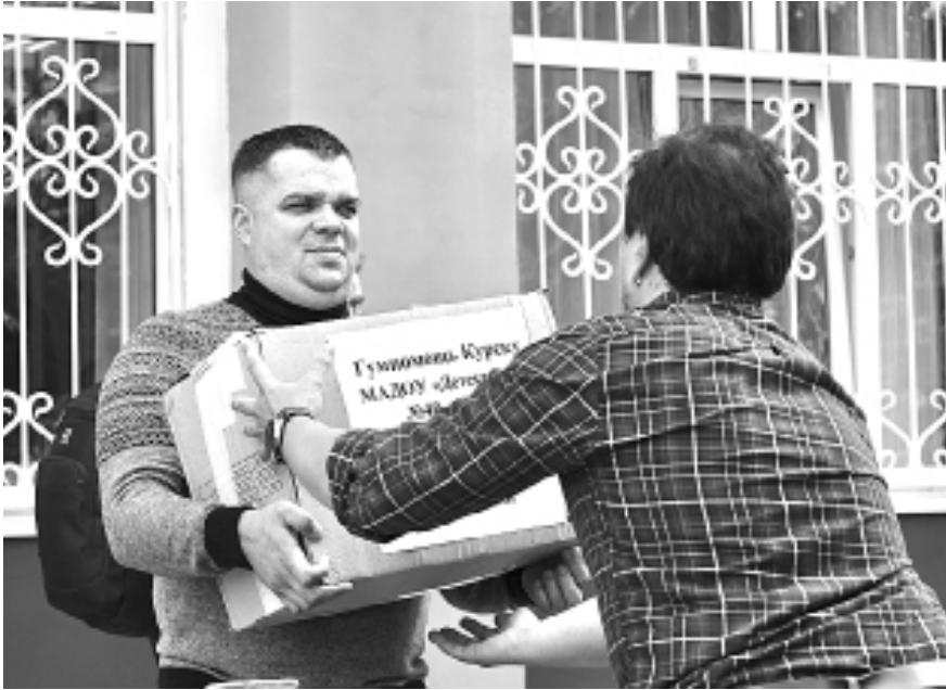
Депутаты участвуют в сборе гумпомощи