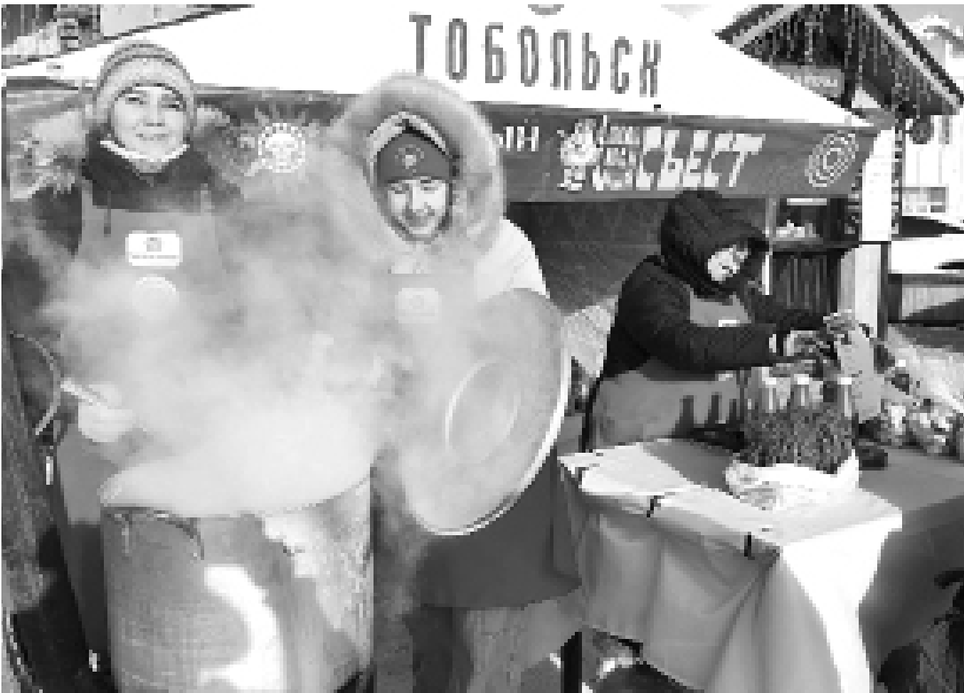
На Базарной площади варятся пельмени для «Съеста – 2023»

В Тобольске первый «Пельменный съест» состоялся в январе 2022 года, в этом году фестиваль пройдёт уже в четвёртый по счёту раз. На протяжении двух недель многие заведения общепита становятся участниками вкусного конкурса фестиваля, разрабатывают своё «пельменное» меню. Посетители кафе и ресторанов-участников «съеста», отведав блюда из этого меню, оценивают их. И по прошествии двух горячих пельменных недель жители и гости города собираются на Базарной площади, чтобы весело и со вкусом подвести итоги фестиваля.