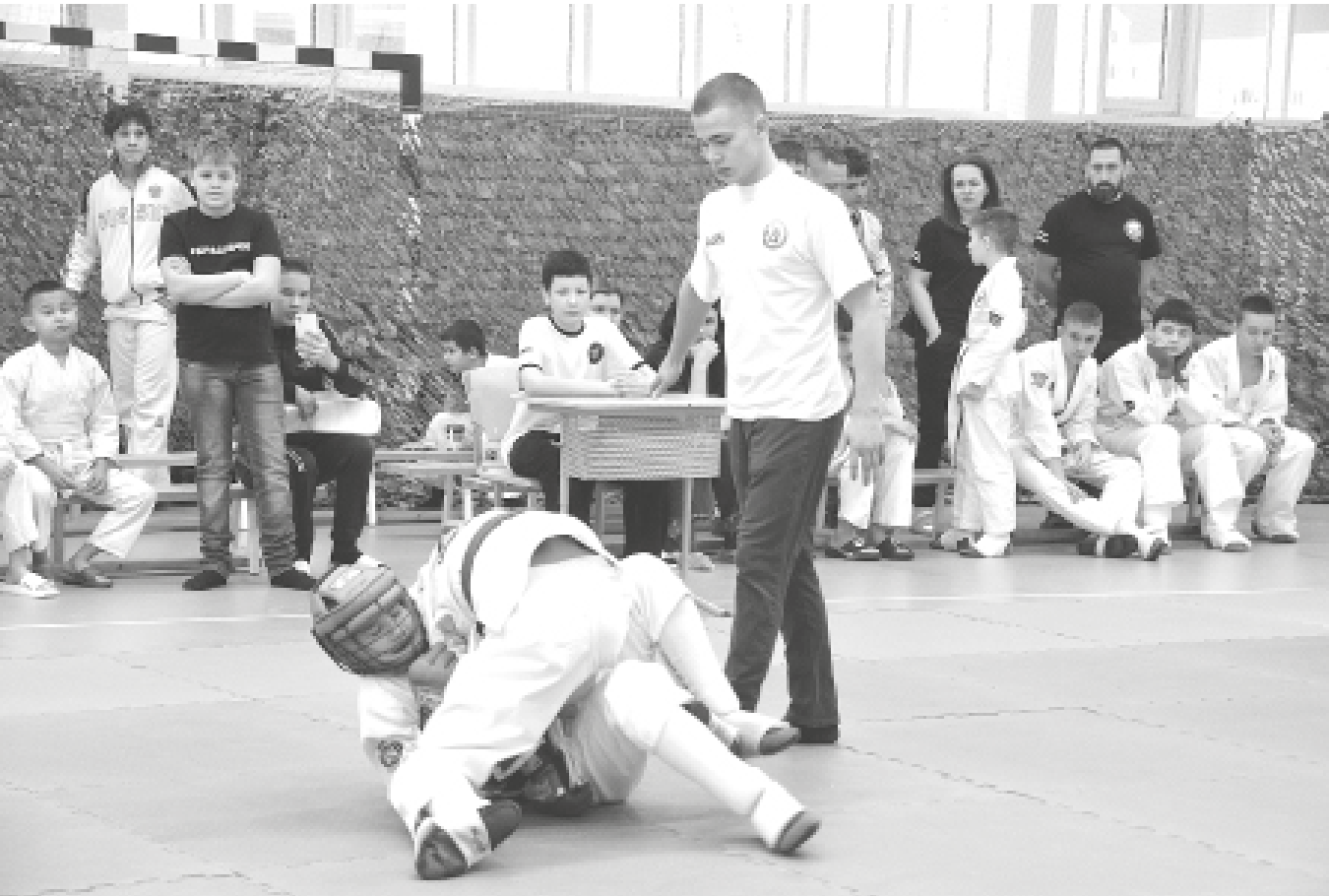
На ковре юные бойцы