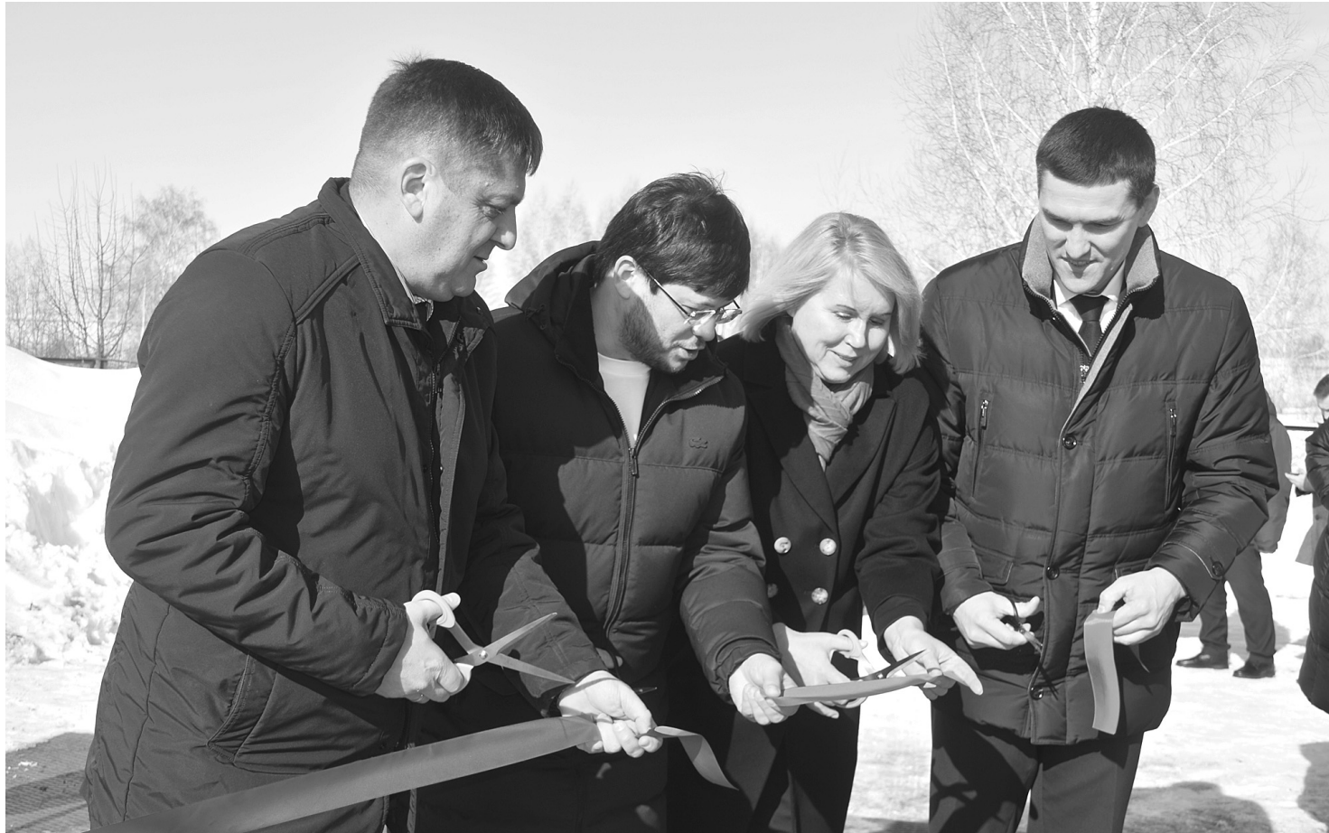
Открытие станции водоочистки – важное событие для муниципалитета