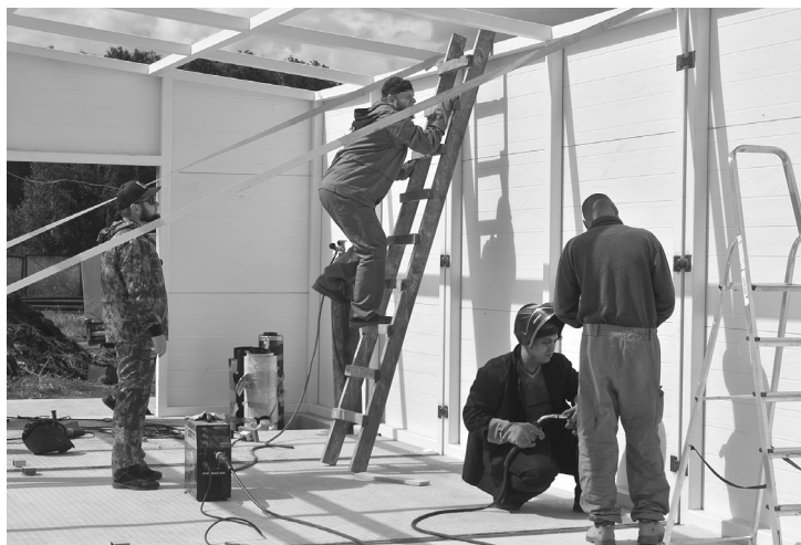
Станцию водоочистки построили и ввели в эксплуатацию за четыре месяца