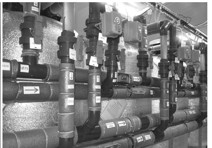
На новую станцию водоочистки вода поступает из двух источников: скважины и озера, проходит четыре ступени очистки