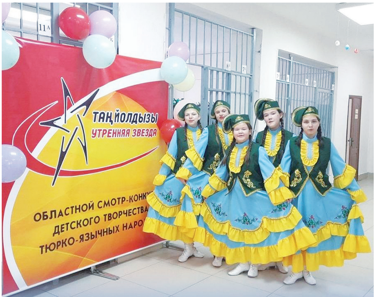
► Юные танцоры из Байкалово.