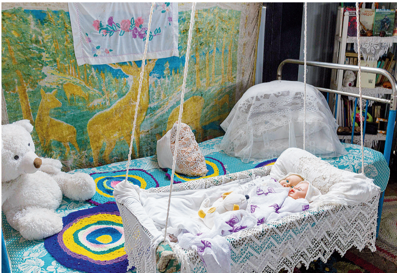
► Спальня, как в советском детстве

Слушая рассказы нашего словоохотливого экскурсовода, мы как будто забыли про время. Собранные коллекции открыли перед нами свои тайны, поведали о счастливых и грустных моментах жизни наших предшественников. И стала вдруг понятна и близка идея хозяев – ведь в даже небольшом сельском уголке можно донести эту память, красоту, семейные реликвии до новых поколений. Чтобы, прикоснувшись к живому коду предков, они осознали себя частью истории – прошлой и будущей.