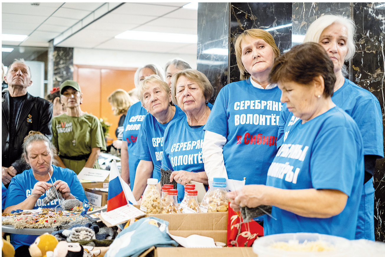
► Дружная делегация прибыла из Сибиряка

Сталинградский котёл решил судьбу больше 300 тысяч солдат и офицеров вермахта. Паулюс,