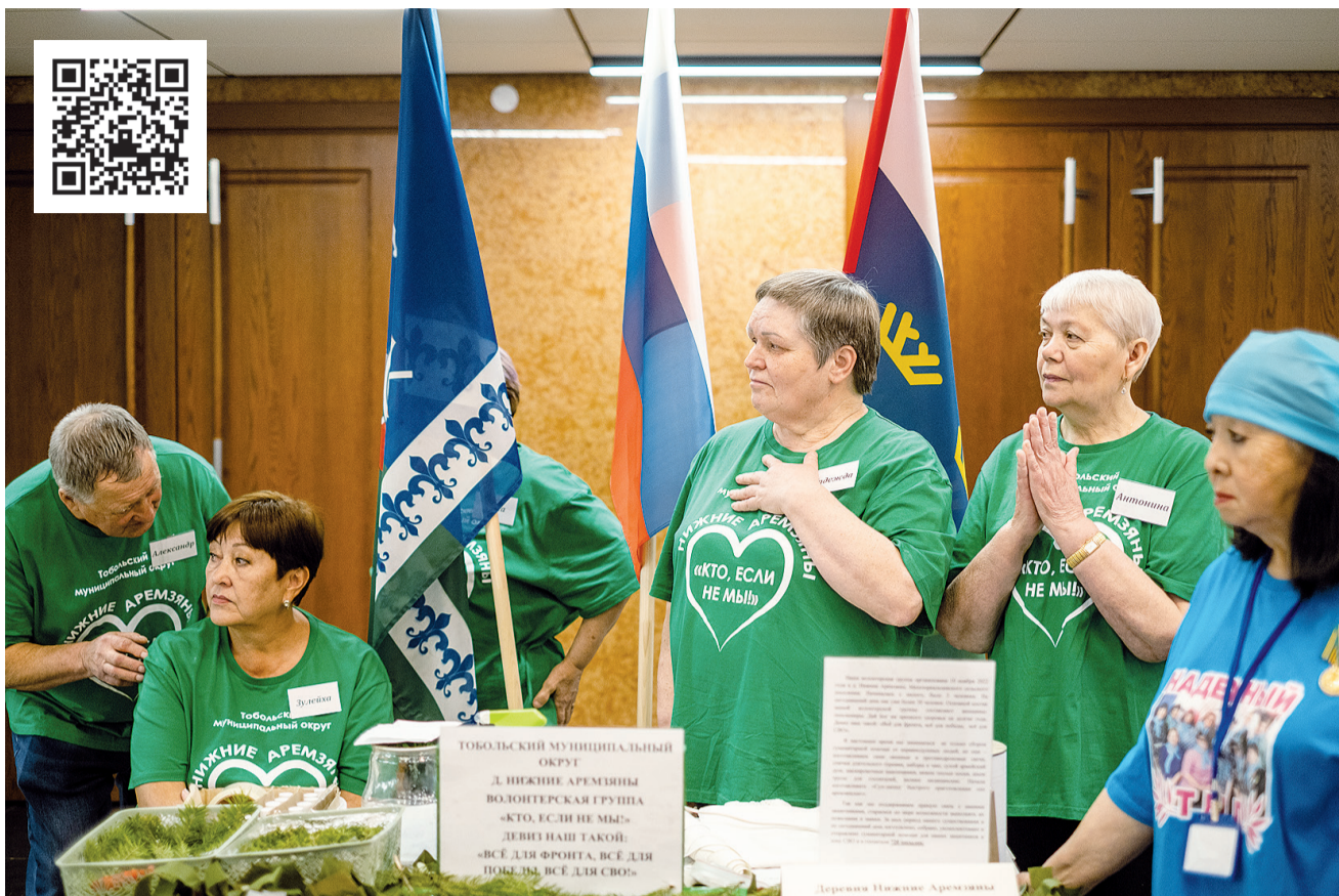
► Команда «Кто, если не мы», Нижние Аремзяны