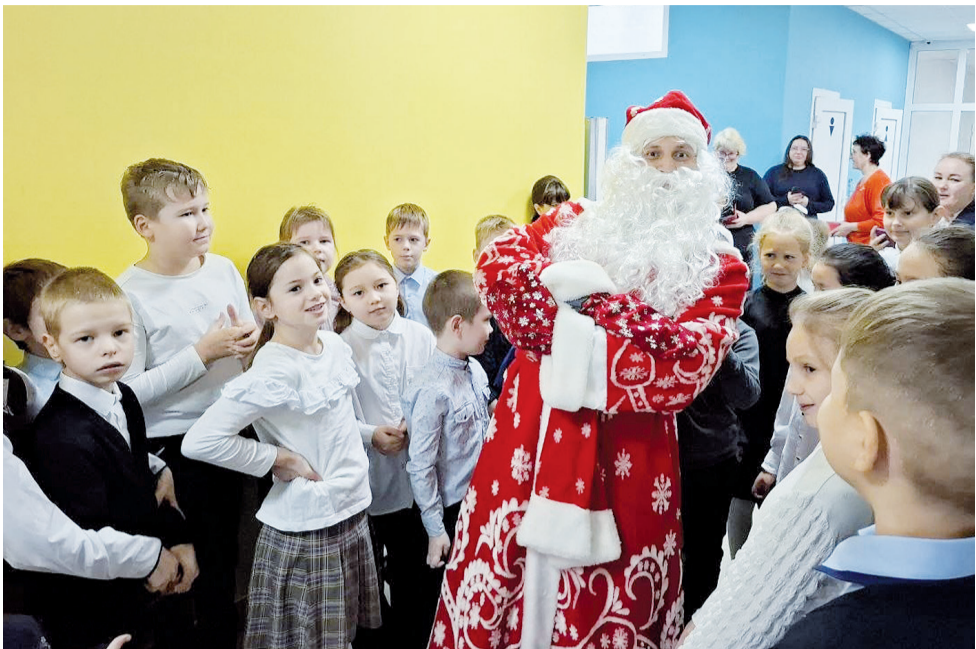
«Подросли, большими стали! А меня-то вы узнали?»

А когда раскрасневшийся именинник в своём ярком наряде переступил школьный порог, восторгу и ликованию детворы не было предела! Весёлые игры, хороводы, общение с главным и любимым персонажем новогоднего праздника подарили детям много радостных минут, погрузили в атмосферу сказки и чудес. О своей мечте и заветном желании детвора написала в письмах, которые передала гостю. До новой встречи, дедушка, ждём тебя 31 декабря! А ЗНАЕТЕ ЛИ ВЫ, что любимой новогодней песенке, которую пели ещё наши бабушки и дедушки, знаменитой «В лесу родилась ёлочка», в 2025 году исполнилось 120 лет? Это