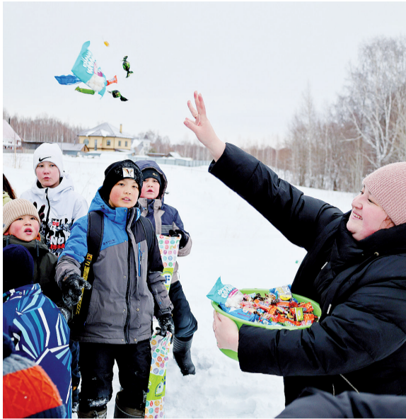
► Амаль – щедрый весенний праздник.