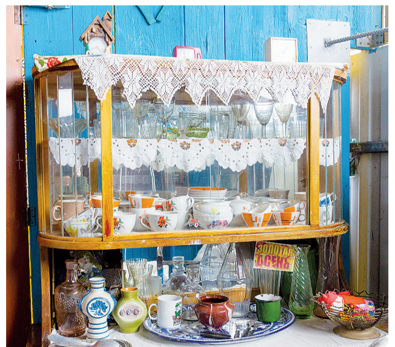
► Сервиз в серванте: хоть сейчас устраивай чаепитие

Немало экспонатов напоминает о недавнем советском прошлом. Лёгкую ностальгию вызывают радиоприёмники, которые в середине прошлого