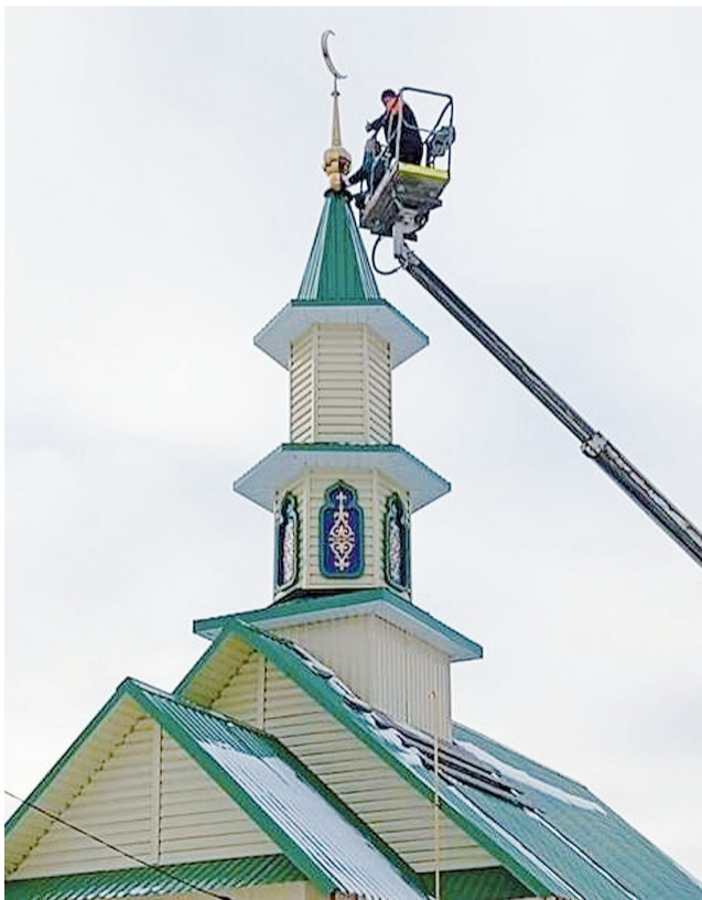
► Добрый знак!

„ Священный полумесяц над минаретом виден издали. А само здание в будущем, думается, станет настоящей достопримечательностью села, увидеть которую захочется не только верующим, их близким и родным, но и всем, чей путь лежит мимо населённого пункта. Открытие мечети в Кутарбитке планируется летом 2026 года