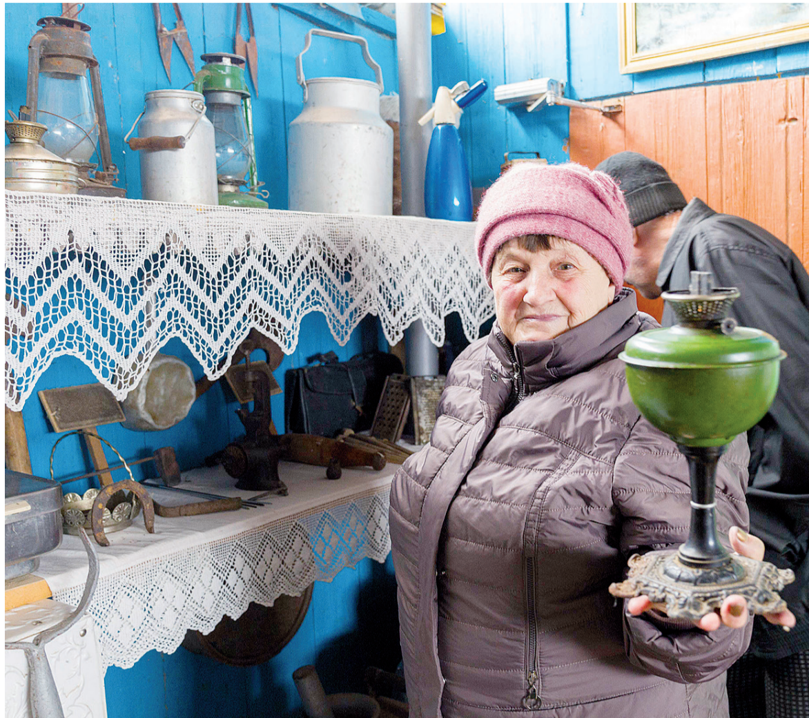
► Настоящий раритет: старинная лампа

Переступаешь порог помещения и как будто оказываешься в прошлом столетии, а то и дальше. Хранятся экспонаты в бывшей летней кухне, среди которых старинные раритетные вещи, бытовая деревянная утварь, предметы советской эпохи. Хозяевам удалось воссоздать обстановку деревенского быта прошлых лет, превратив пространство уголка в музейную экспозицию, которая насчитывает более сотни редких и уникальных экземпляров. Старинный ухват, корчага, крынки, увесистая корзина с бутылкой, коробка, берестяной туесок и тяжёлое седло... Деревянных изделий здесь много, и эти артефакты не только притягивают