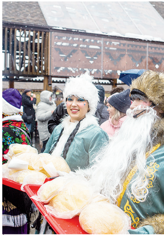
► Кыш-бабай и Кар-кызы на Дне Сибири в Тобольске

„ Священный полумесяц над минаретом виден издали. А само здание в будущем, думается, станет настоящей достопримечательностью села, увидеть которую захочется не только верующим, их близким и родным, но и всем, чей путь лежит мимо населённого пункта. Открытие мечети в Кутарбитке планируется летом 2026 года