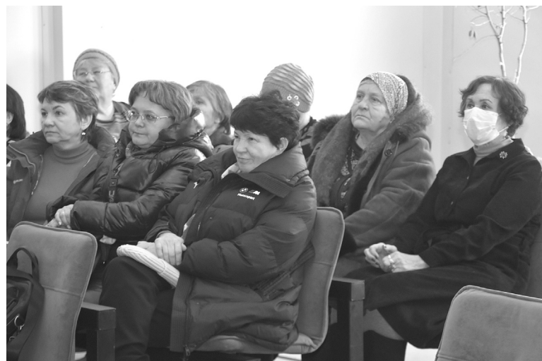
На собрании истошинцы интересовались вопросами благоустройства в селе, обозначили проблему качества воды