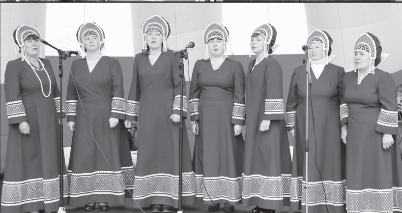
В селе праздник

Североплетнёвцы, жители Лабино и Шипаково с благодарностью говорят о четверговом дополнительном рейсе в Северо-Плетнёво. Четверг, что называется, базарный день. На районном рынке бойкая торговля, и североплетнёвцы охотно выезжают этим рейсом в Юргу. А ходатайствовала о решении вопроса сельская дума. В каждый дом протянут газопровод. Этой осенью двадцати льготникам его подключат бесплатно. Решается вопрос о ремонте здания бывшей амбулатории. Там будет шесть квартир для молодых специалистов. Проблема кадрового дефицита в селе обозначена на всех уровнях власти. В Северо-Плетнёво есть конкретное видение решения проблемы. И всё это при инициативе и поддержке депутатского корпуса.