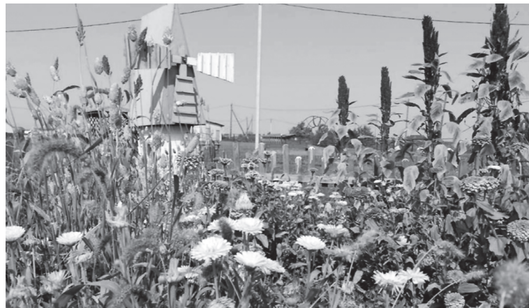
Многоцветье на территории специальной школы-интерната высоко оценило жюри