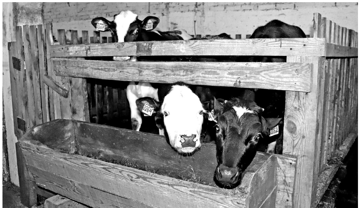
• Устойчивое развитие животноводства на территории городского округа — залог уверенности в завтрашнем дне.

— Получение хороших привесов, как известно, зависит от двух факторов: кормления и содержания