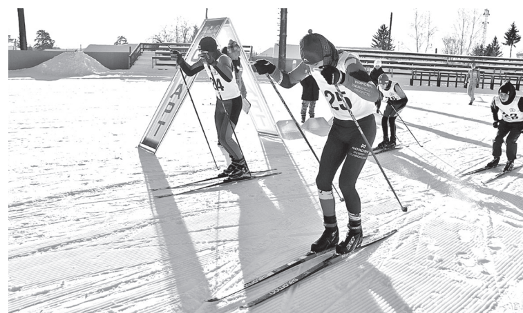
• На старте курсанты группы добровольной подготовки к военной службе «Патриот» из школы № 1.

По итогам этих стартов, а также соревнований по силовому многоборью, прошедших в конце ноября, сформируют сборную городского округа для участия в спартакиаде среди допризывной молодёжи Тюменской области. Первый этап этих состязаний пройдёт 7 — 8 февраля в Заводоуковске.