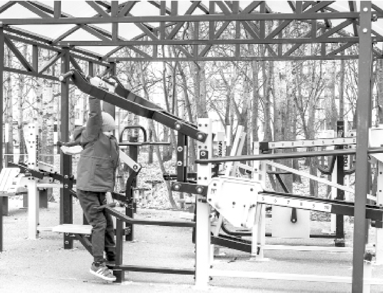
► Южная территория сквера ориентирована на активный отдых