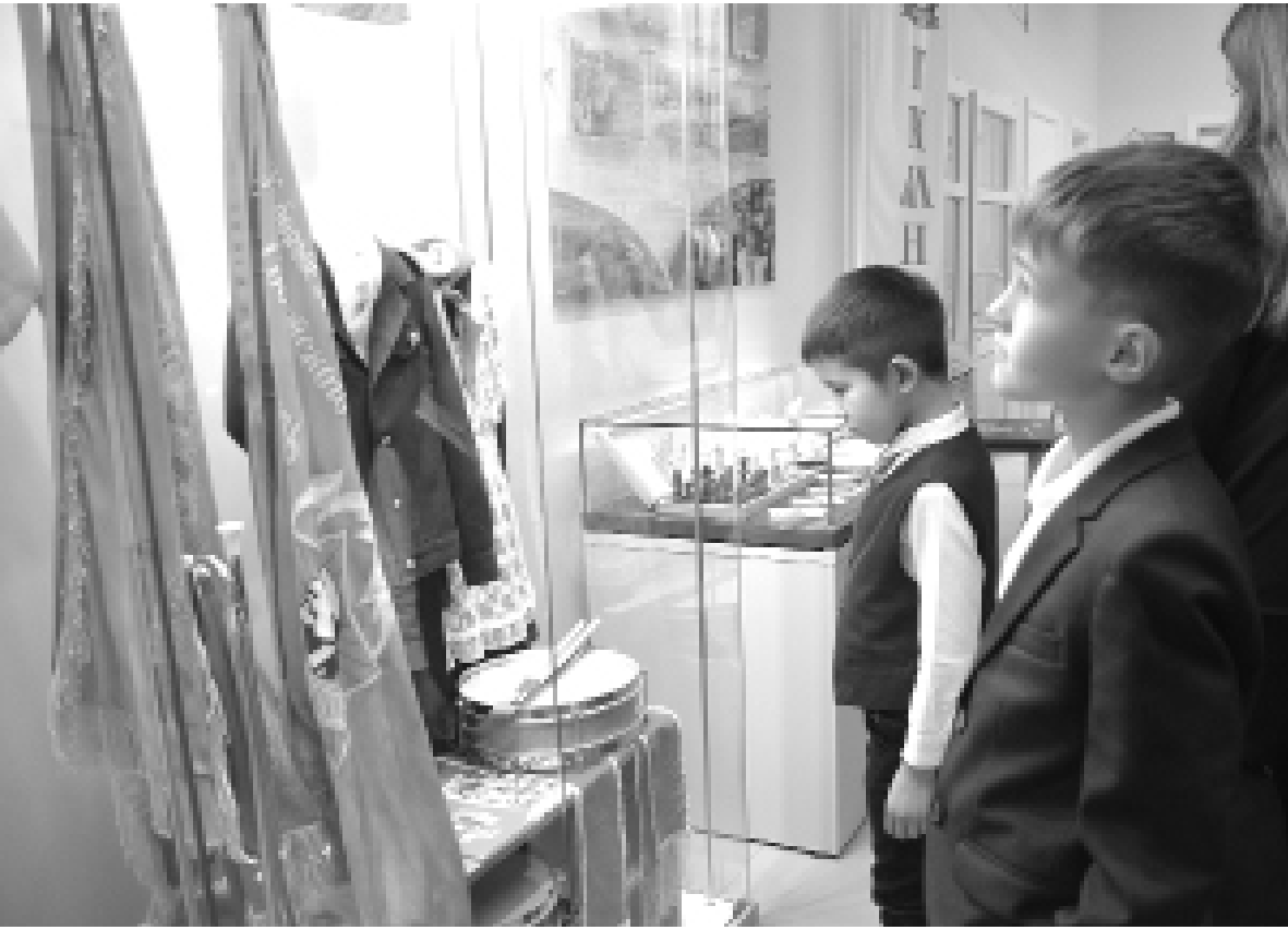
► Обновлённые витрины вызвали интерес у первых посетителей

«Проект «Малая родина – большая история» – это не просто витрины с экспонатами. Это музейное пространство, где переплетаются судьбы гимназии, города и страны. Через историю тобольского гимназического образования, судеб выдающихся жителей города, героизм земляков в годы Великой Отечественной войны и сегодняшних защитников – участников специальной военной операции мы показываем, как малая родина становится частью великой истории