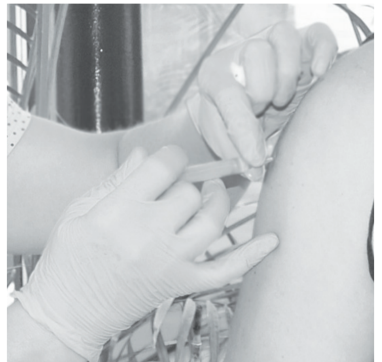
Вакцинация - защита для каждого.