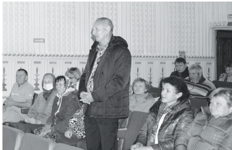
На встрече в Коркино состоялся деловой разговор.