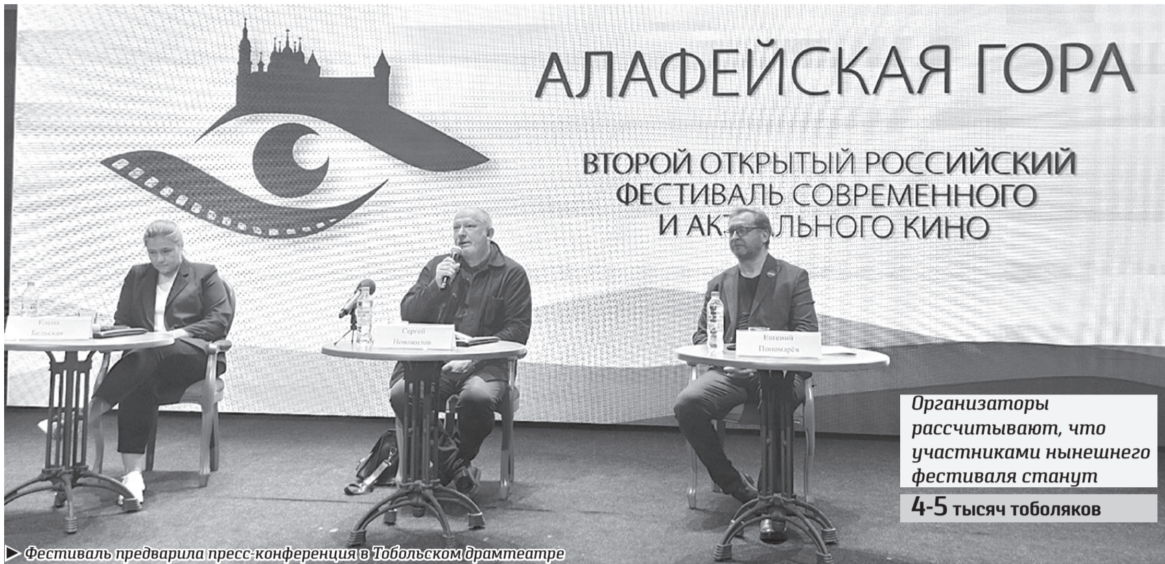
Фестиваль предварила пресс-конференция в Тобольском драмтеатре

Организаторы рассчитывают, что участниками нынешнего фестиваля станут 4-5 тысяч тоболяков