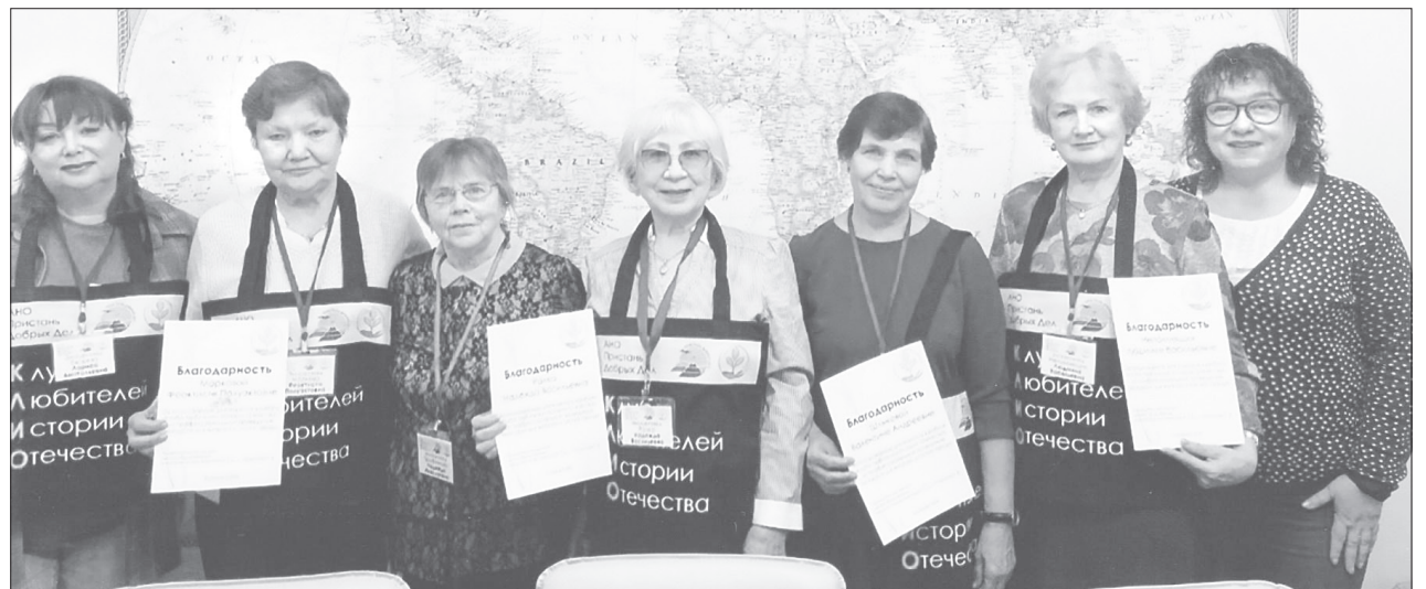
Встречи клуба проходят в разных форматах: