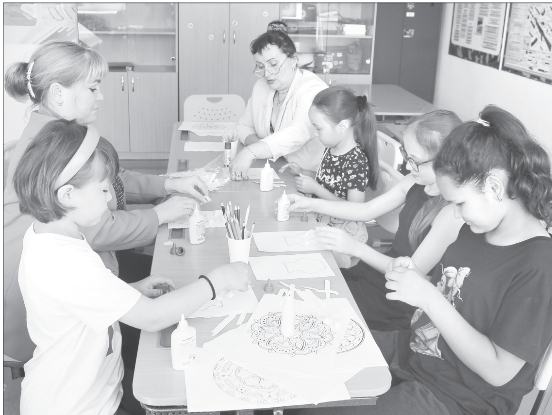
С детьми на встрече в Новоатъялово провели творческий мастер-класс

Общими усилиями. В ходе беседы участники обсудили работу волонтерских движений. Новоатъяловское сельское поселение является одним из самых активных в Ялutorовском