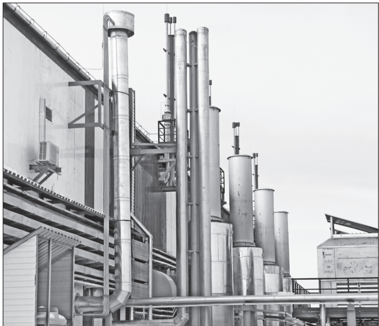
ГТЭС на Усть-Тегууском месторождении.

В выходные за комплекты наград поборются участники суперспринта - в гонке на сверхкороткой дистанции. Начало соревнований: в 11 часов - квалификация и 13 часов - финал.