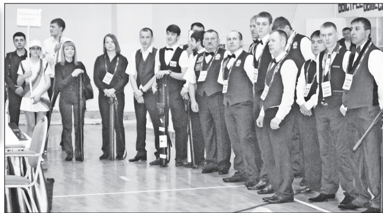
Сборная Тюменской области.

Появление круговых турниров связывают с традициями снукера, руководит этим направлением в России вице-президент Федерации бильярдного спорта Тюменской об-