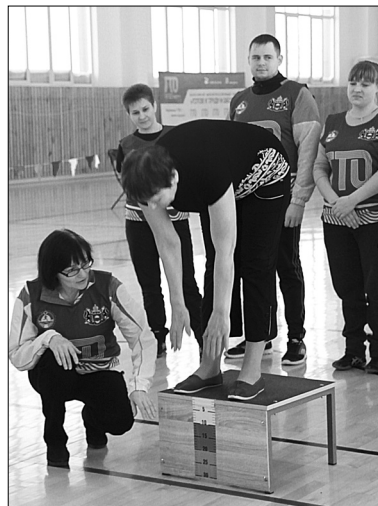
Норматив по наклону туловища многими сдан успешно

Надежда ЧЕРЕПАНОВА.