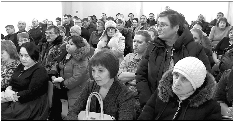
Бескозобовцы на ежегодной встрече задали руководству Голышмановского городского округа свыше 30 вопросов

Большинство вопросов на встрече руководства округа с жителями Бескозобовской территории были связаны со сферой социальности.