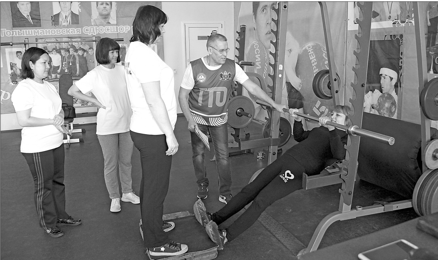
Из кабинета – в спортзал: педагоги школы № 2 демонстрируют отличную физическую подготовку