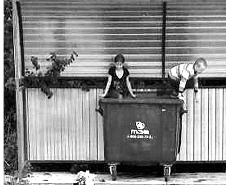
Развлечения на площадке для сбора коммунальных отходов могут обернуться травмами!

Кроме того, не редкость, что после детских забав на