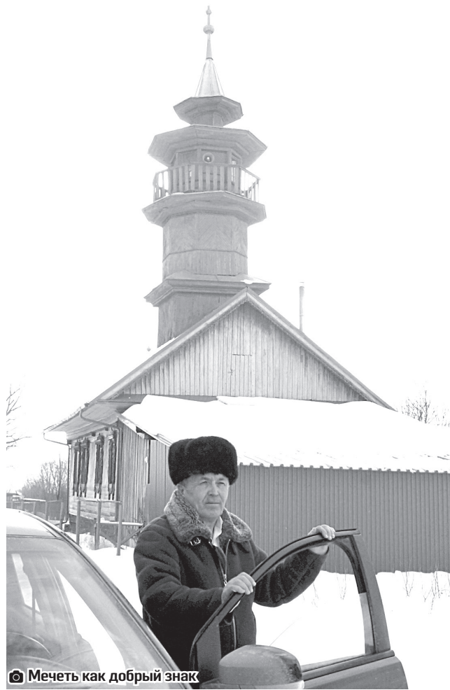
Мечеть как добрый знак

– Открытия мечети ждут практически все жители поселения, – отмечает глава. – Это событие воспринимается как добрый знак, вселяющий надежду и уверенность в том, что жизнь на нашей территории заиграет яркими красками.