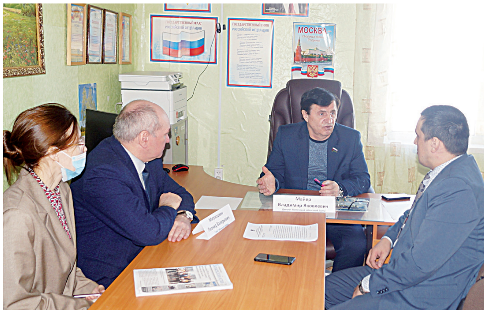
Серьёзный диалог в Ачирах

Животрепещущие темы. В Лайтамаке депутат традиционно провёл личный приём граждан, на который пришли два человека с ограниченными возможностями здоровья с просьбой помочь деньгами на ремонт жилья. Ещё один пенсионер просил денежную поддержку на приобретение предметов первой необходимости. Эти обращения