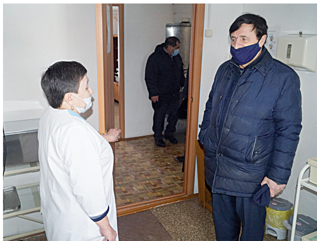
В Лайтамаке без фельдшера

водой. Станция подготовки питьевой воды имеется только на центральной усадьбе. А в прикреплённых к ней четырёх деревнях остаётся обычным явлением, когда воду для пищи зимой жители болотных островков добывают, растапливая лёд, а летом