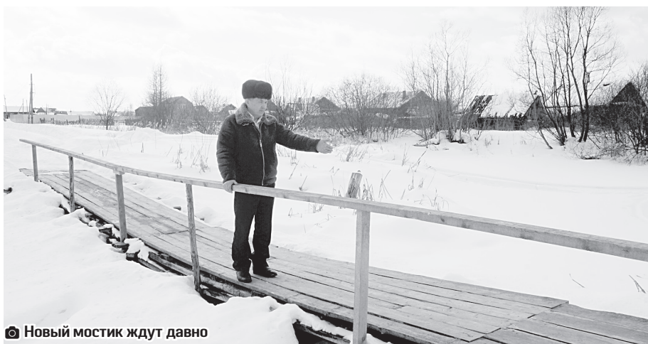
Новый мостик ждут давно

Есть примеры уже решённых проблем. Жители посёлка давно просили продлить маршрут рейсового автобуса, который останавливался на окраине посёлка, что было крайне неудобно, особенно для пожилых людей. Теперь автобус доезжает до центра населённого пункта. Летом там будет установлена остановка.