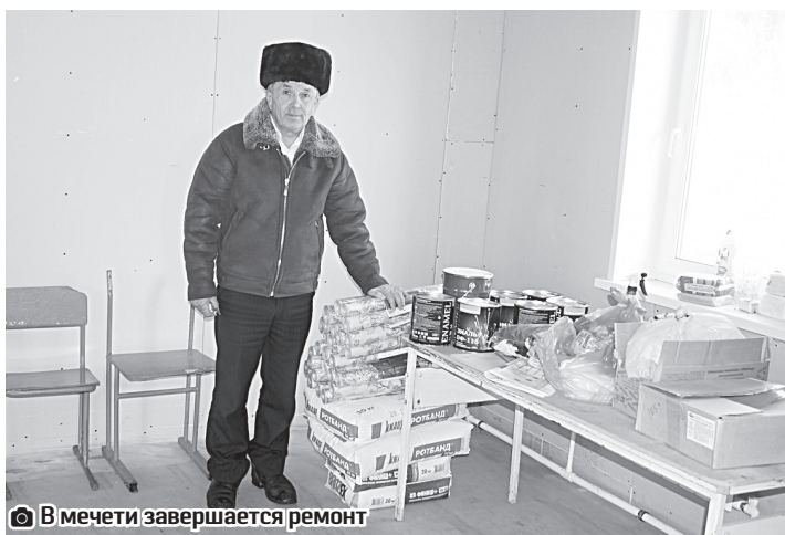
В мечети завершается ремонт