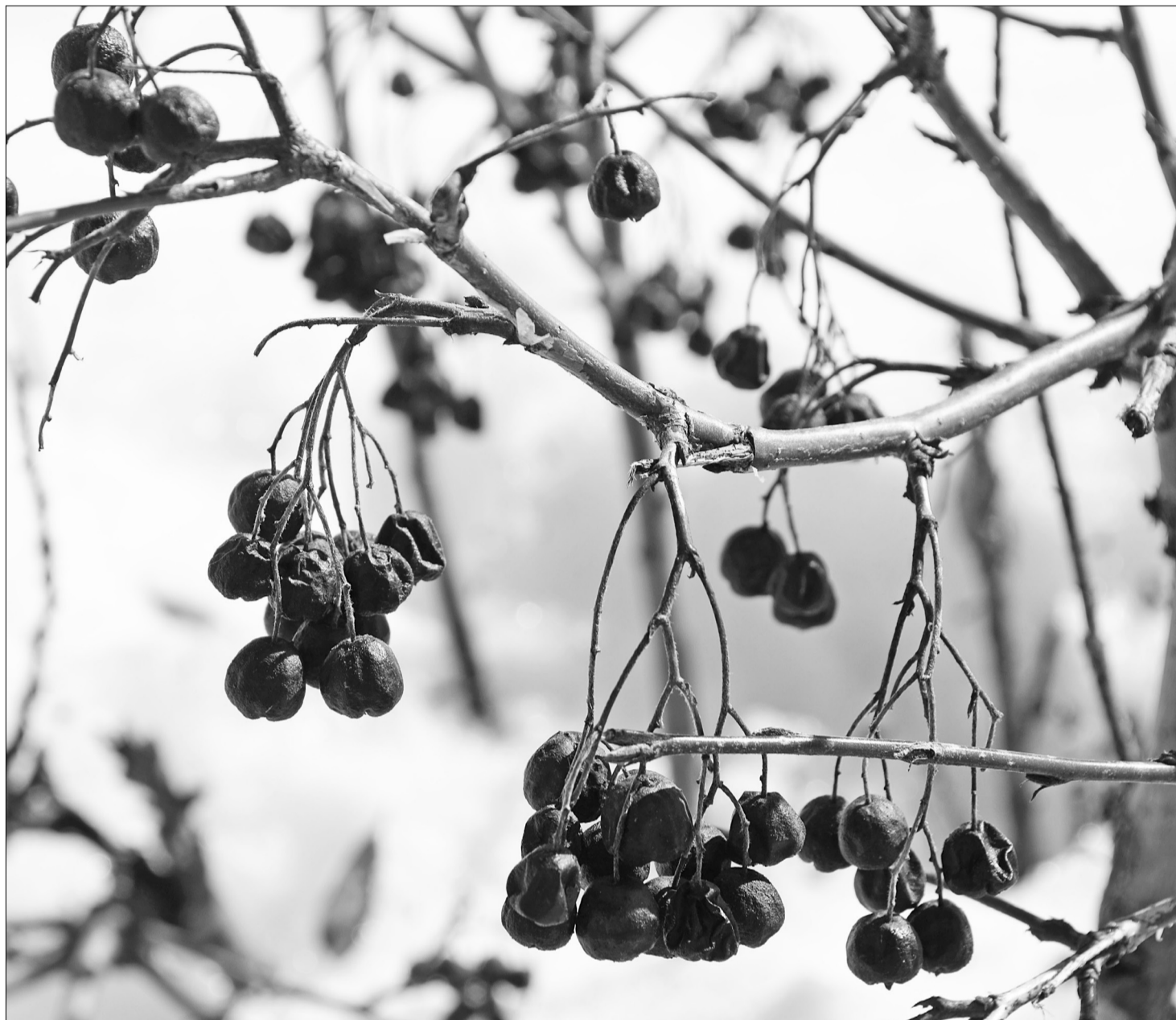
■ Выглянула из-под снега черноплодная рябина. Природа просыпается от долгого зимнего сна, а вместе с ней оживает и словотворчество.

Говорят мне: «Неумный детина! Жизнь - секунда, и надо успеть Дуновением жарким хамсина Над чужою женой пролететь. Дикий мёд упоительно сладок, Белых лилий прозрачен фарфор - Тают воинств штывки и армады Перед входом в изысканный двор.