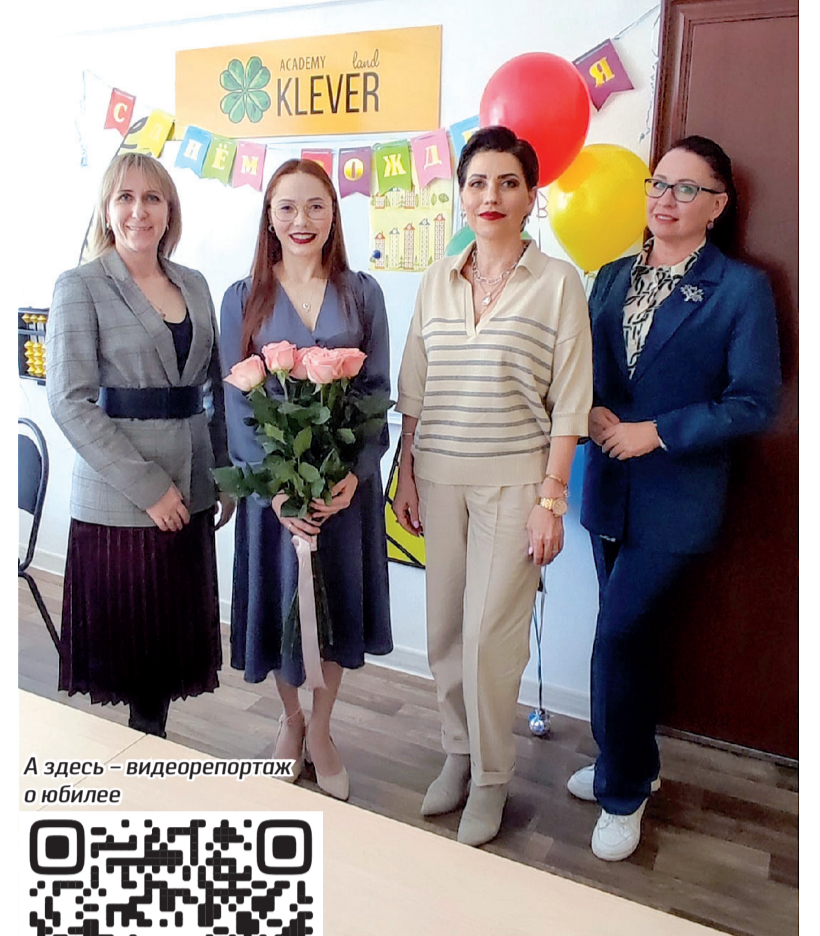
А здесь – видеорепортаж о юбилее

«За 5 лет более тысячи юных тоболяков учились у нас (не считая летних периодов), к сожалению, из-за 2020 года, когда мы почти весь год и даже захватили следующий, учились только онлайн. Летом на нашей досуговой площадке занимается не меньше 150 детей (летний ла-