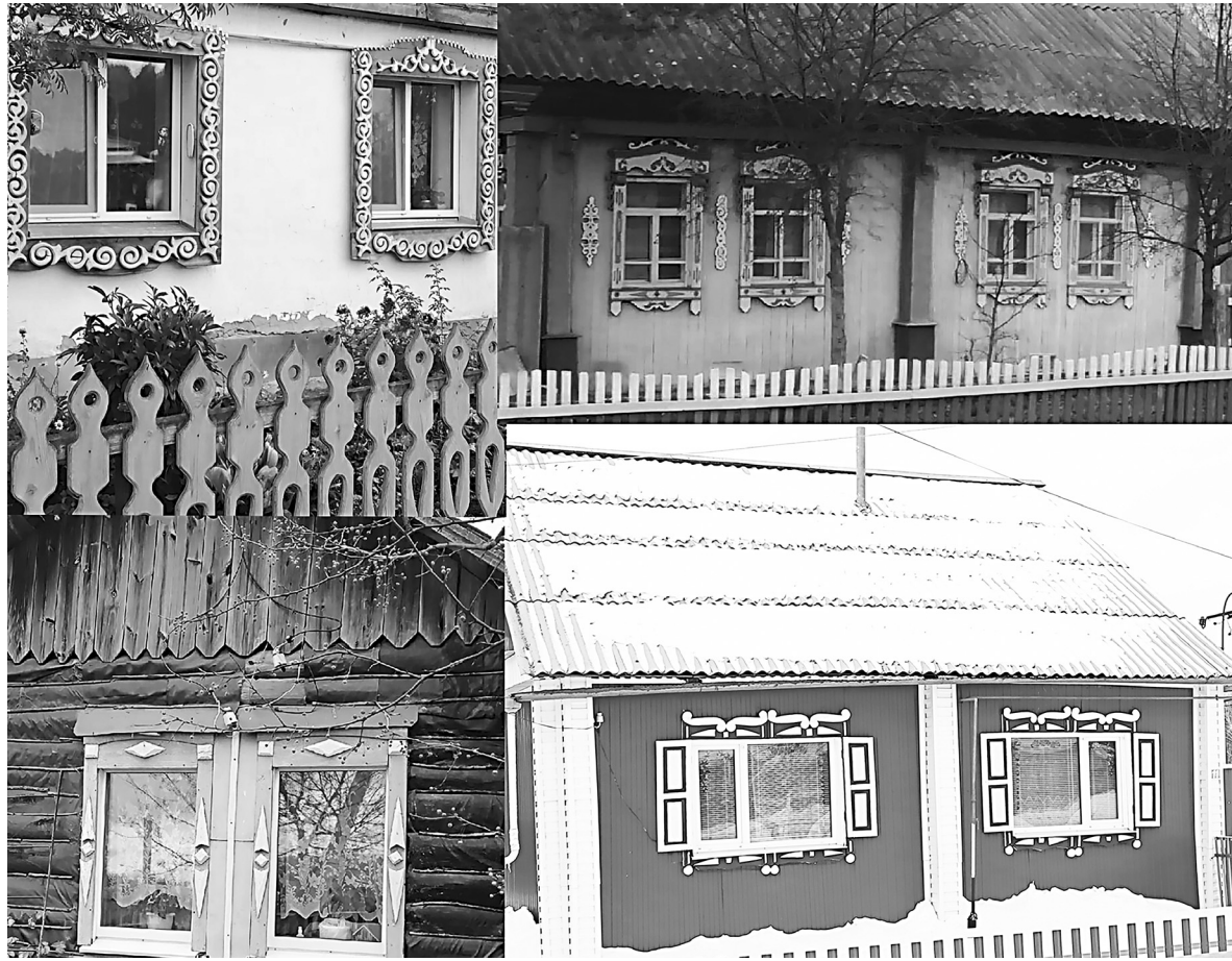
А на окне – наличники: в Голышмановском округе сохранились примеры накладных украшений для окон домов

Фасад дома воспринимался в старину как его «лицо», где фронтон виделся как «чело», а окна – как «глаза». Не случайно на фасадах старых деревенских построек размещалось, обычно, по два окна. С переходом к окнам, обрамлённым косяками, появилась сначала одна (вверху), а затем четыре доски, прикрывающие стыки косяка и брёвен сруба от снега и дождя. Сначала декоративно оформлялась только верхняя доска – зубцами, квадратиками, ромбиками и другими фигурными порезками. В дальнейшем орнамент стали делать и на других элементах наличников. На них появляется резьба с мотивами круга-солнышка.