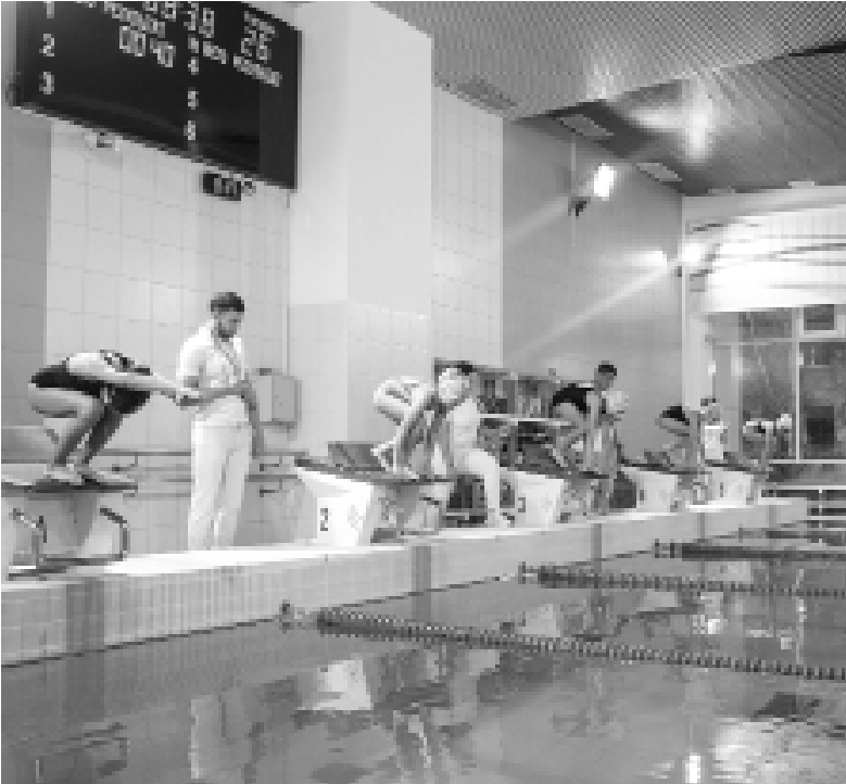
► В заплывах участвовало около 400 спортсменов