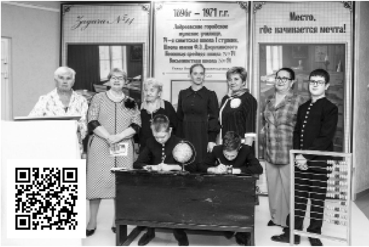
► Учителя и ученики – бывшие и нынешние

Тобольской школе № 14 исполнилось 140 лет