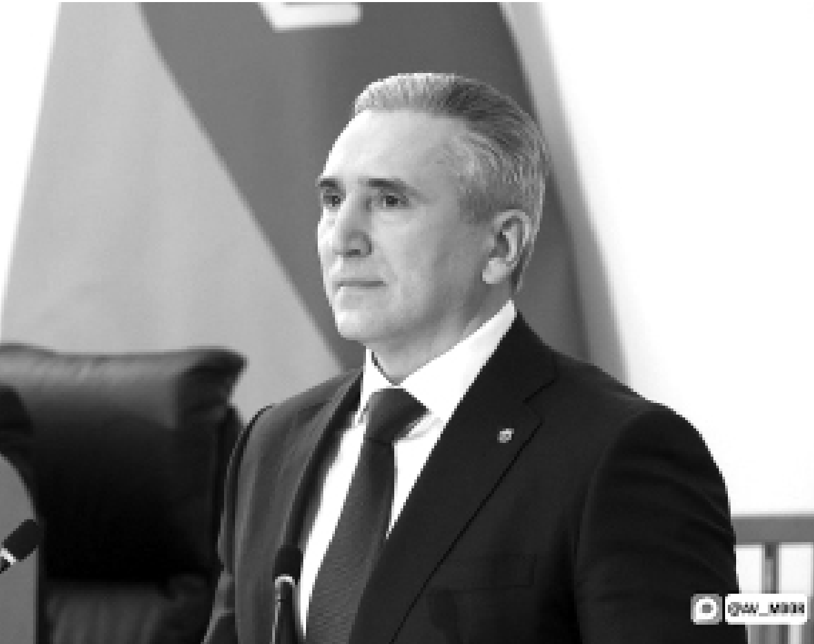
► Александр Моор

Губернатор Тюменской области Александр Моор в послании депутатам областного парламента обозначил важнейшие направления развития региона на ближайшие годы и подвёл итоги 2025 года.