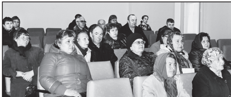
В зрительном зале СДК

ных действий, общих вопросов благоустройства. Совершено 52 нотариальных действия, сведения о которых направлялись в Тюменскую областную нотариальную палату для внесения в реестр единой информационной системы нотариата в зашифрованном виде с помощью программы КриптоАРМ.