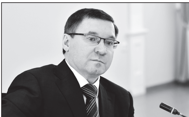
Губернатор Тюменской области В.В. Якушев

Соблюсти баланс по открытию новых производств и наладить стабильную работу уже существующих – сложная задача, которую решают и региональные, и муниципальные власти, подчеркнул Владимир Владимирович Якушев. Глава региона отметил, что сложности в инвестиционной деятельности есть, и речь не только о Ялуторовске. «Мы активно работаем над тем, чтобы в области появлялись новые предприятия, дополнительные рабочие места, но возникают ситуации, когда предприятия, которые работали достаточно долго, в силу разных причин закрываются. Мы очень много сил вкладываем в открытие новых