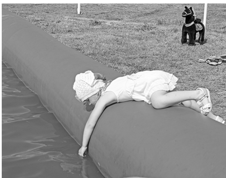
* У бассейна

Услуги экскаватора и фронтального погрузчика на базе «МТЗ-80», кран-манипулятор «КамАЗ» до 3-х тонн, перевозки до 20 тонн. Обр.: т.т. 8 9829038739, 8 9123864774.