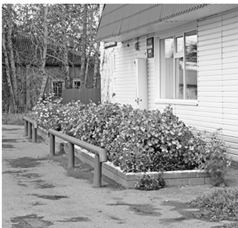
* Цветочные клумбы на центральной площади