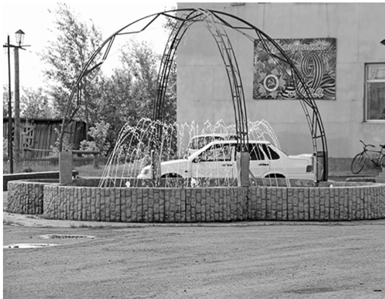
* И снова радует фонтан

Была запланирована посадка деревьев в честь 70-летнего юбилея Победы. Но вынесли совместное решение с ТОС – саженцы появятся на территории осенью. Уже готовится для этого площадка. Аллея будет высажена в черте посёлка и станет ещё одним местом культурного отдыха для жителей и гостей. За каждой организацией будут закреплены