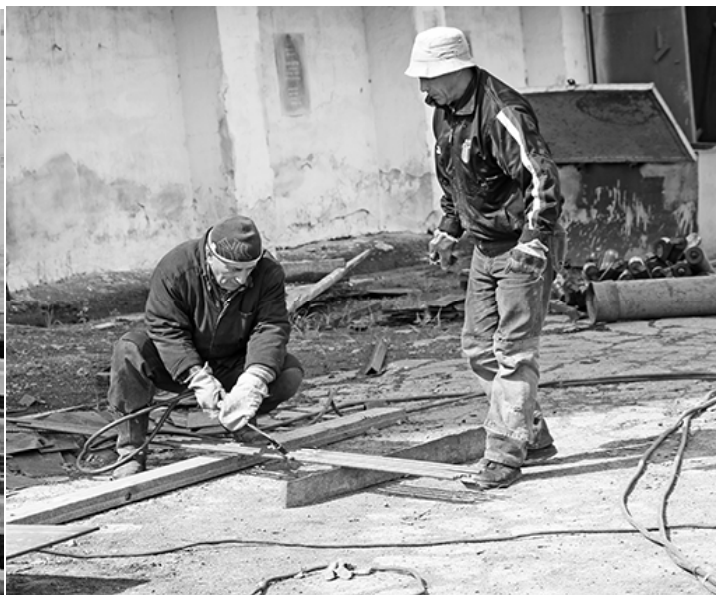
* Работа на предприятии не останавливается