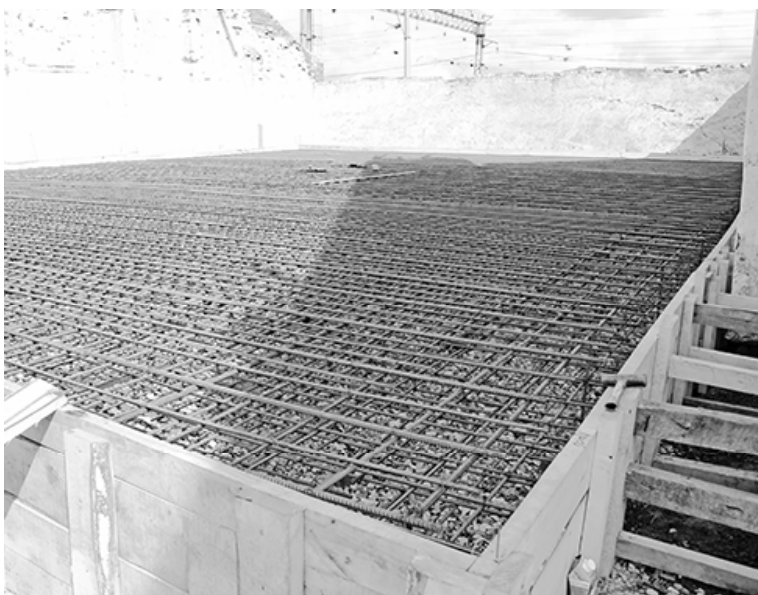
* Фундамент почти готов