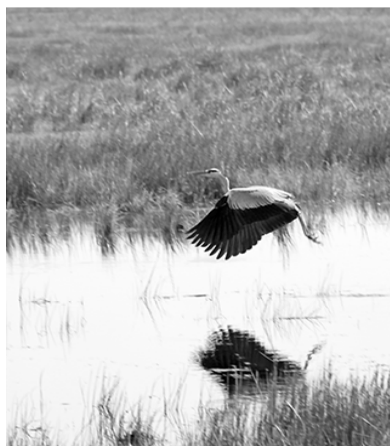
* У родных берегов