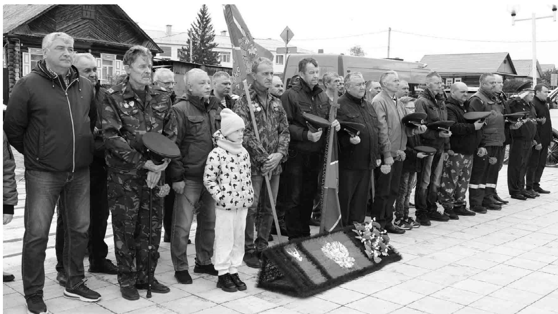
Пограничное братство, наш девиз - «Не сдаваться»

106-ю годовщину со дня образования пограничной службы России отметили 28 мая в селе Омутинском.