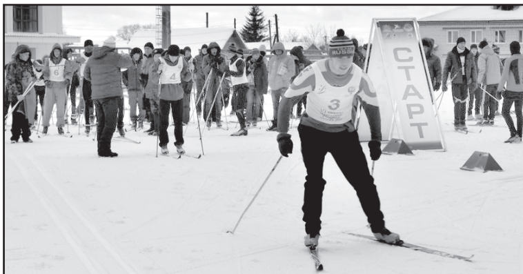
На старте – лыжники