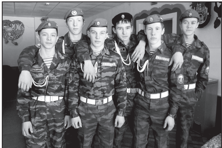
Команда Юргинского района