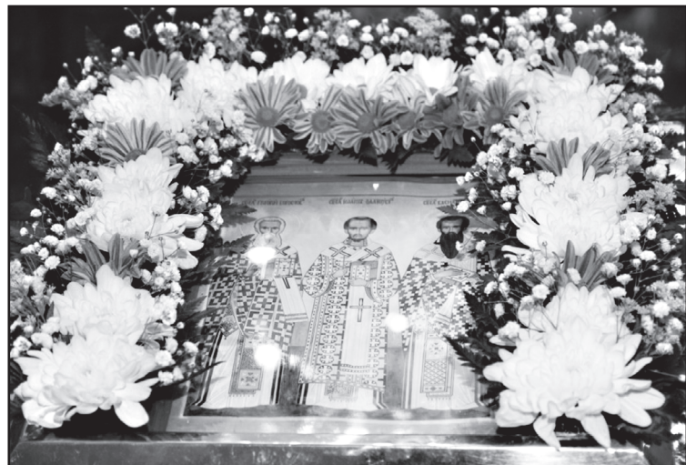
Икона Трёх святителей

А ещё одна из глав начинается так: «Дайте мне преемника образованного, достойного ходить в звании своём!» – в прощальной речи перед жителями Константинополя восклицал святитель Григорий Богослов. Желание Григория исполнилось в 398 году на исходе бурного века, когда константинопольскую кафедру занял Иоанн Златоуст. Самые знаменитые проповедники всех веков христианства уступают Златоусту, слово которого поистине жгло людские сердца. Речь его, часто грозная, огненная, об-