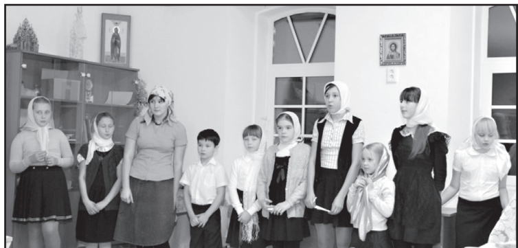
Воспитанники воскресной школы

личительная, была полна любви к ближнему. Слово праведного Иоанна осветило древний мир благодатным, врачующим светом. От того он и назван в истории Златоустом».