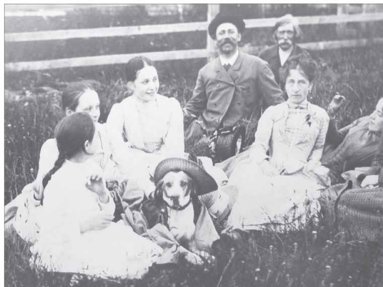
Семейные традиции были очень сильны в роду Мамонтовых, например, совместное фотографирование на праздниках

Интересные данные собраны о предках и потомках этой удивительной семьи.