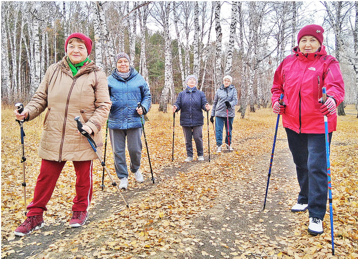
Известно, что движение – жизнь. И это правило действует в любом возрасте

В советское время было принято делать зарядку по утрам. Для этого даже транслировались специальные передачи по радио и телевидению. Сегодня возможно найти себе общеукрепляющее занятие по душе – сколько угодно. Одно из таких – скандинавская ходьба.