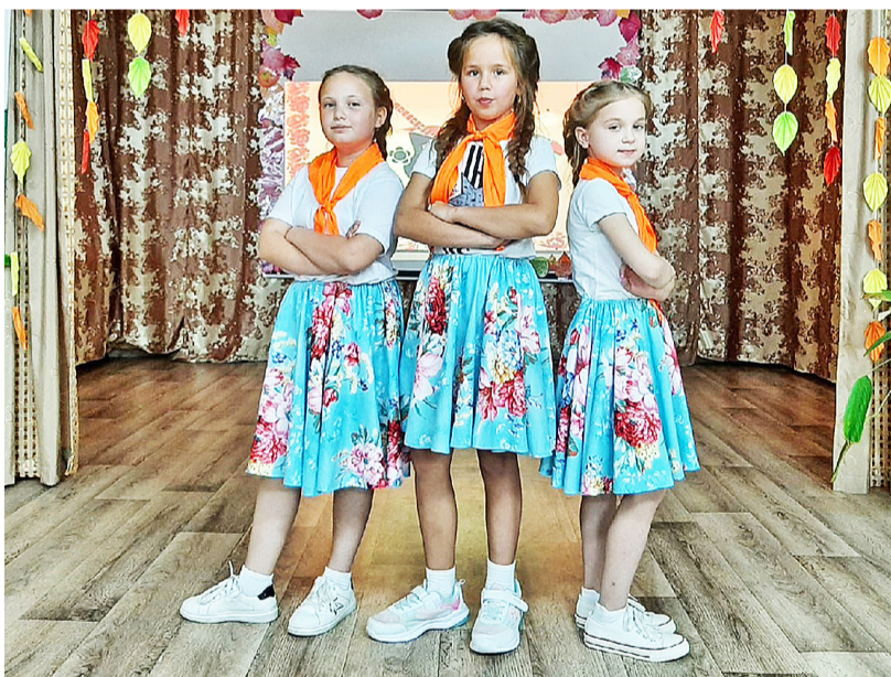
Во время смены ребята и обучаются, и творчески самовыражаются

Светлана СУРОВЦЕВА