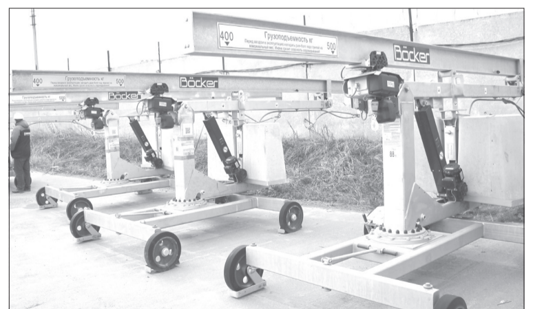
Так выглядят мобильные мини-краны для монтажа крупноформатных блоков

Как в конструкторе. Рост выпуска газобетонных блоков планируется в первом квартале следующего года. Работу нового крупноформатного