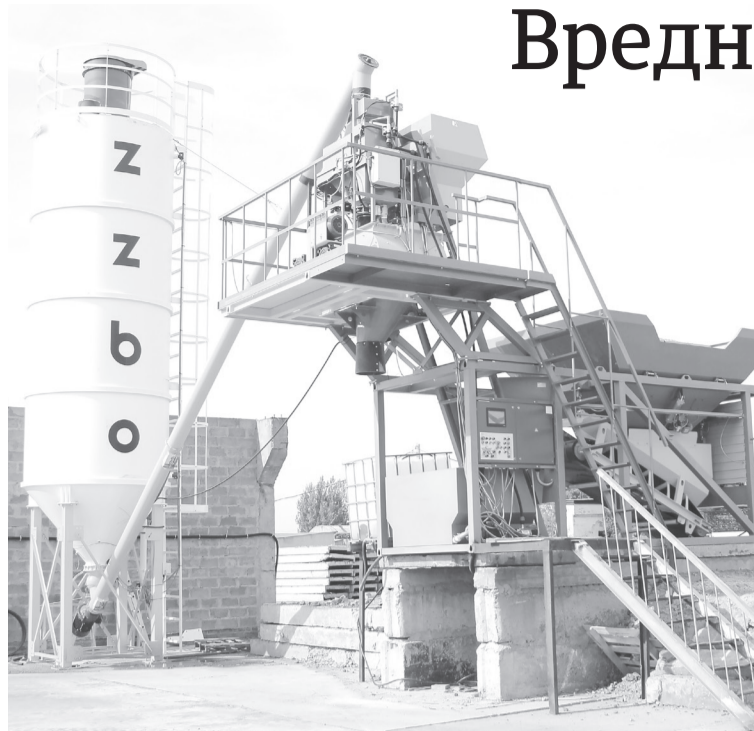
Мини-завод будет в закрытом помещении