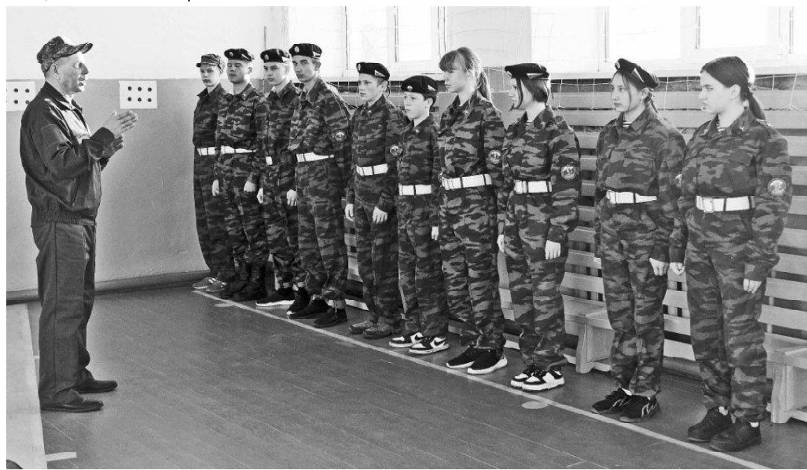
➤ На построении