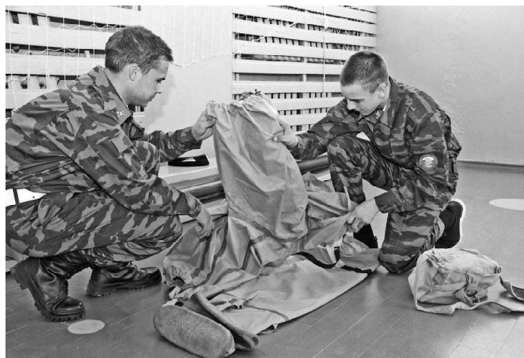
➤ Костюмы химзащиты