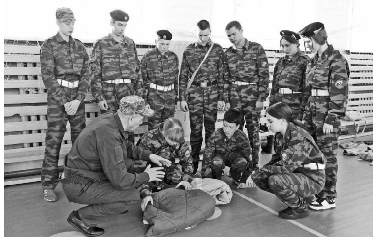
➤ Теория и практика – рядом