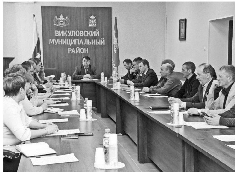
➤ Совещание с руководителями организаций