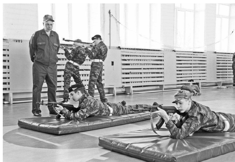
➤ Огневая подготовка