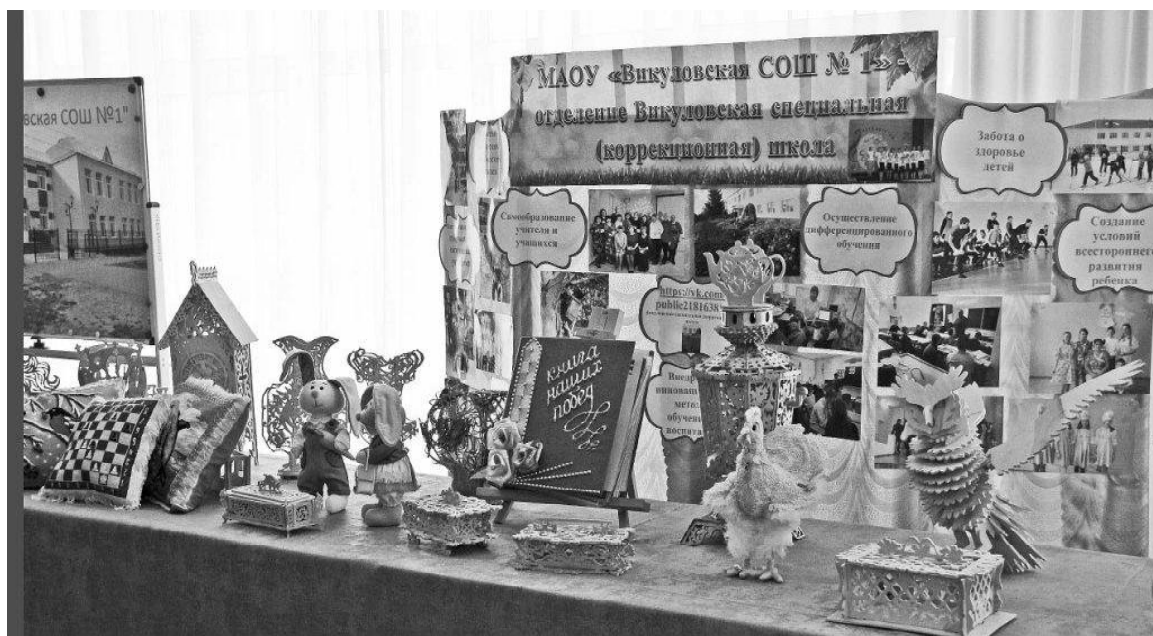
› Выставка работ коррекционной школы

Поздравления сменялись яркими номерами. Впереди, в Год