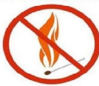
ВЫЖИГАНИЕ СУХОЙ ТРАВЯНИСТОЙ РАСТИТЕЛЬНОСТИ