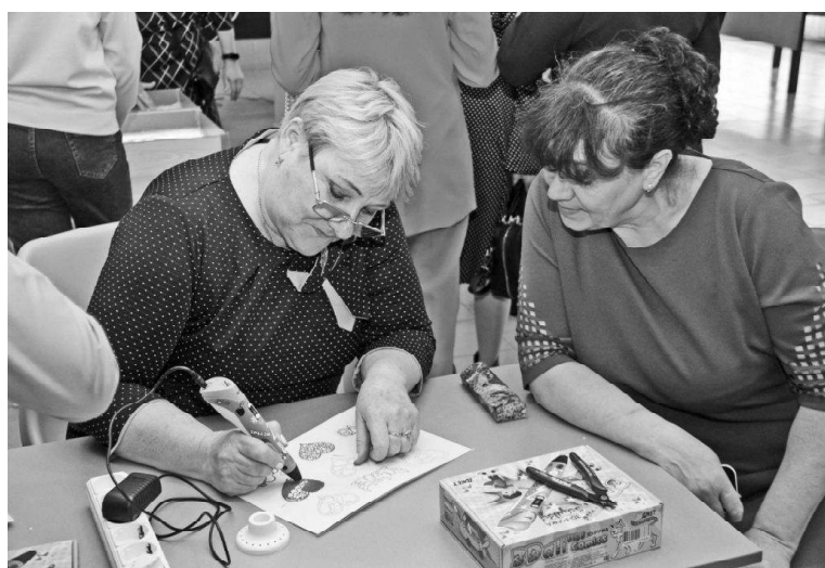
› 3d-ручка в действии!

Много тёплых слов прозвучало в адрес педагогов и наставников, молодых специалистов, ветеранов отрасли и педагогических династий. Благодар-