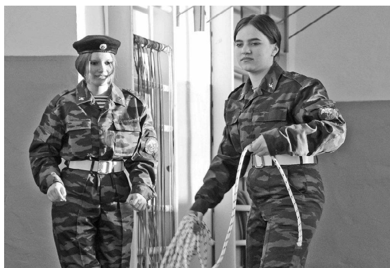
➤ Бросают верёвку в цель