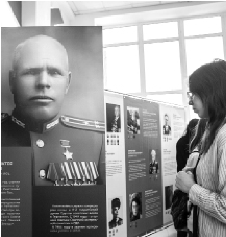
► На стендах – истории Героев

ПЕРВАЯ – выставка лучших детских рисунков, с конкурса «Тебя, Сибирь, мои обнимут длани». В номинации «Герои СВО» ребята нарисовали своих родственников или просто земля-