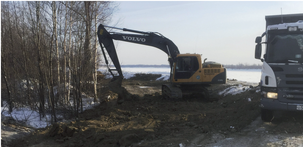
В Алымке отремонтировали гидротехническое сооружение.